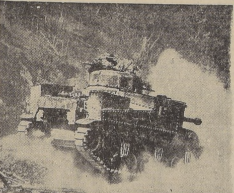
Un tanque de las fuerzas británicas del 14o Ejército, atacando una posición japonesa en el frente de Birmania.

El torrencioso Choqueyapu, que a través de los siglos ha caído un deflador en el cráter en que se encuentra La Paz, ha sido encajonado en una obra de concreto, a fin de impedir una mayor erosión; sin embargo, algunos deslizamientos en su curso inferior ocurrieron en febrero de este año.