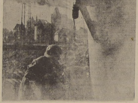
La más grande cortina de humo jamás tendida en toda la guerra cubre los preparativos británicos para la ofensiva del Rhin. Aquí tenemos el generador mecánico en acción.

Tropas británicas habrían rebasado ciudad de Muenster