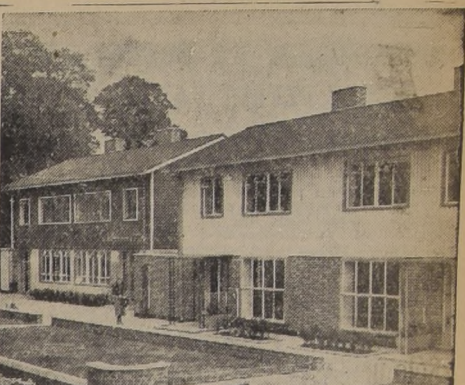
Casas de postguerra están en exhibición en Middlesea, donde el Ministerio de Trabajo de Gran Bretaña ha construido una serie de casas de exhibición. Algunas son prefabricadas; otras son de armazón de acero e construidas de ladrillo y albañilería.

WASHINGTON, 29. (U. P.). — El anuncio de la Casa Blanca dice textualmente: "Los representantes soviéticos en la Conferencia de Yalta indicaron su deseo de plantear en la Conferencia de las Naciones Unidas de San Francisco, la cuestión de la representación para las Repúblicas Soviéticas de Ucrania y Rusia Blanca en la samblea de la proyectada organización de las Naciones Unidas".