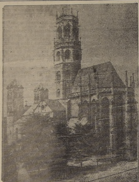
Vista de la iglesia de San Ludger, en la ciudad de Munster. Este edificio constituye una de las mayores monumentos arquitectónicos de toda la Westfalia.

A 200 KILOMETROS DE BERCHTESGADEN La irrupción de las tropas del (PASA A LA PAGINA 7)