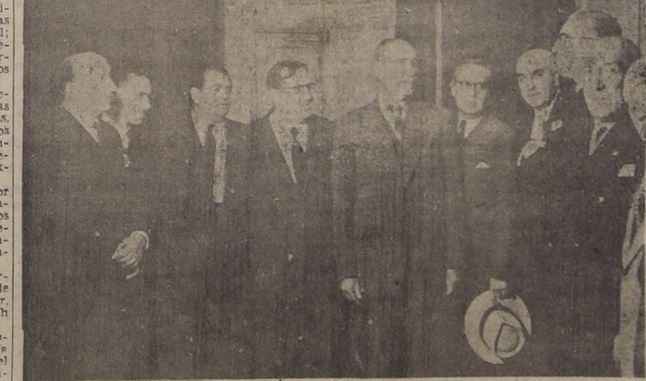
Impresiones captadas por nuestros fotógrafos durante las visitas efectuadas ayer a la Casa de Gobierno, para saludar al Excmo. señor Ríos