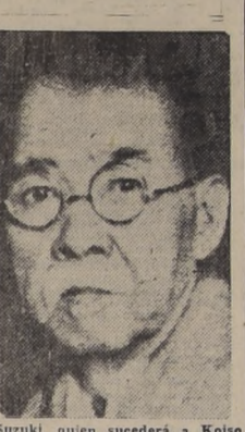
Suzuki, quien sucederá a Koiso a la cabeza del Gobierno

PARIS, 5.—(U. P.)—(Por Bruce Munn).—Las tropas del Tercer Ejército norteamericano están avanzando hacia las montañas de Harz, 192 kilómetros al suroeste de Berlín, mientras el Noveno Ejército del general Simpson, más al norte, cruza el río Weser por varios puntos y tiene un frente de 65 kilómetros para embestir por la carretera septentrional que conduce a la capital alemana.