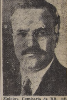
Molotov, Comisario de RR. EE. soviético

Aún cuando la denuncia no constituye un rompimiento de relaciones, el Gobierno soviético ha dejado en claro que considera a Japón como un "cuasi-enemigo". El pacto fue firmado el 13 de abril de 1941 por un período de cinco años y entró en vigencia cuando la aprobación por las dos partes estuvo completa el 24 de abril. Desde entonces, el pacto ha sido renovado en la medianoche del 24 al 25 de abril de 1945 y de acuerdo con lo estipulado se lo consideraba automáticamente prorrogado por igual lapso si una de las partes no notificaba a la otra su decisión de abrogarlo, notificación que debió hacerse con un año de anticipación. La denuncia de hoy significa, por otra parte que "técnicamente" el pacto sigue vigente hasta abril del próximo año.