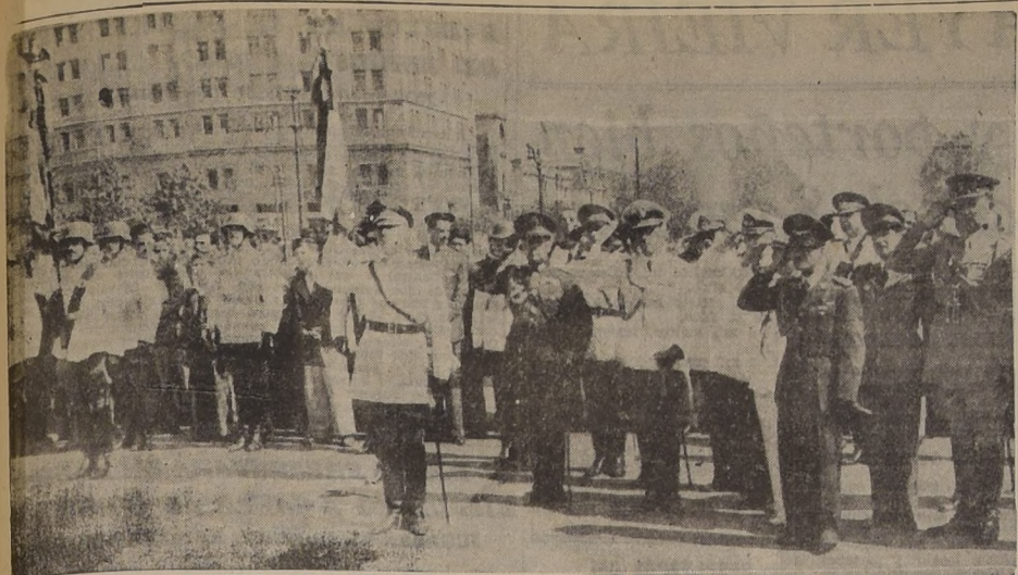
Jefes y Oficiales de caballería frente al Monumento a don Bernardo O'Higgins