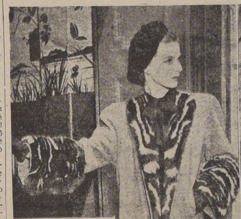
Dos lindos modelos para el Otoño creados por los modistos de Nueva York.

El primero es un abricuito corto en color gris chinchilla, adornado de vueltas y grandes puños de lino. Se lleva sobre cualquier vestido liviano.