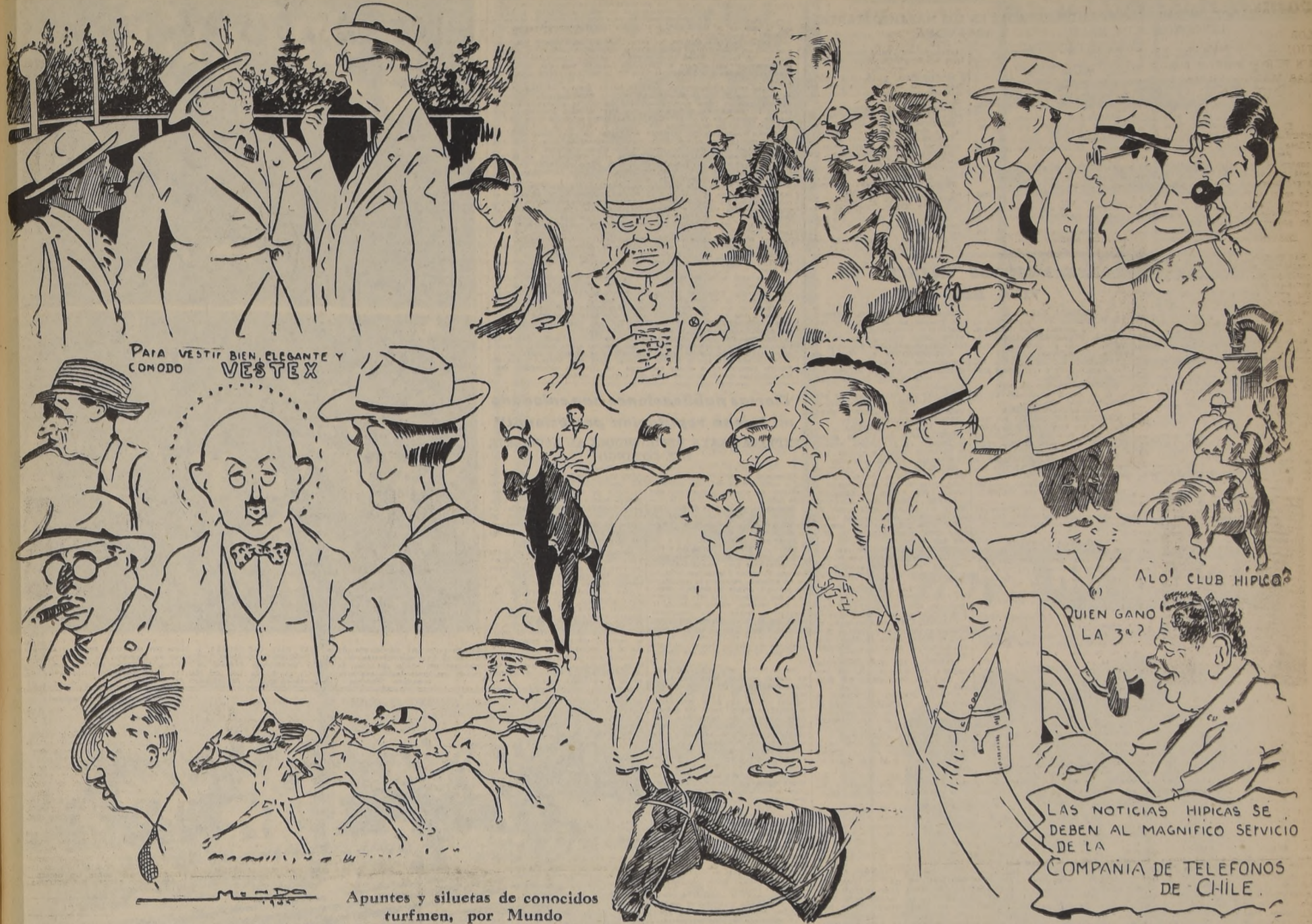
Apuntes y siluetas de conocidos turfmen, por Mundo

LAS NOTICIAS HIPICAS SE DEBEN AL MAGNIFICO SERVICIO DE LA COMPANIA DE TELEFONOS DE CHILE.