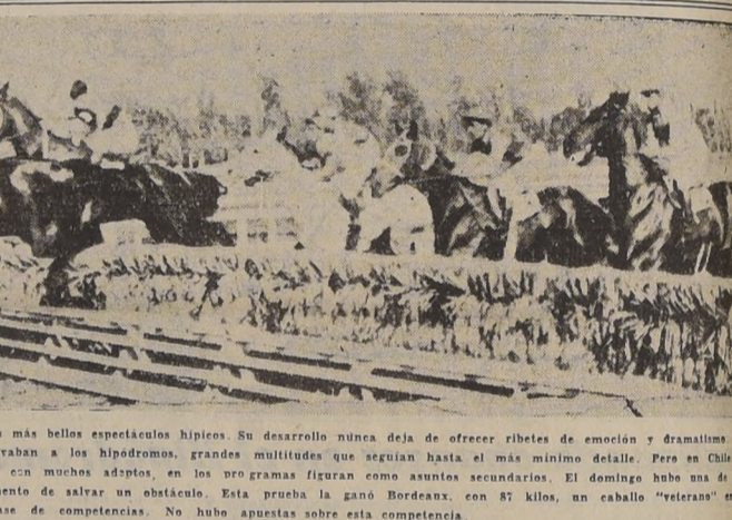
Las carreras de obstáculos, son uno de los más bellos espectáculos hípicos. Su desarrollo nunca deja de ofrecer ribetes de emoción y dramatismo. En Europa, antes de la actual guerra, llevaban a los hipódromos, grandes multitudes que seguían hasta el más mínimo detalle. Pero en Chile, por el desarrollo del turf y a que cuentan con muchos adeptos, en los programas figuran como asuntos secundarios. El domingo hubo más de diez carreras y el grabado muestra el momento de saltar un obstáculo. Esta prueba la ganó Bordeau, con 87 kilos, un caballo "velocista" en su clase de competencias. No hubo apuestas sobre esta competencia.