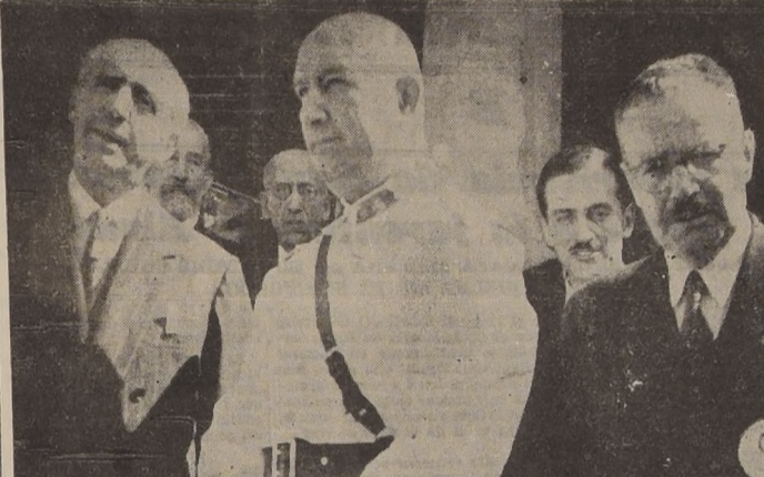
El Excmo. señor Rios acompañado del Comandante en Jefe del Ejército, general señor Portales y del ex Presidente de la República señor Carlos Ibáñez en el Estadio Militar.

de la Muerte", fué la expresión más legítima del héroe popular chileno y su figura ha llegado hasta nosotros como la evocación más fiel del auténtico luchador por la independencia y es por eso que el Ejército, celoso custodio del patrimonio y de las virtudes ciudadanas, al colocar la primera piedra del monumento cuya erección le encomendará el Supremo Go-