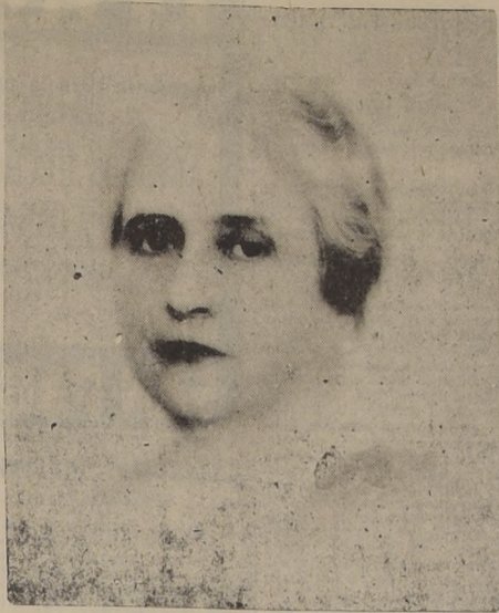
La Corporación acordó dejar constancia en el acta del profundo sentimiento de pesar que ha causado este sensible fallecimiento enviar una nota de pésame al señor Domingo Amunátegui Solar y concurrir en cuerpo, a los funerales.