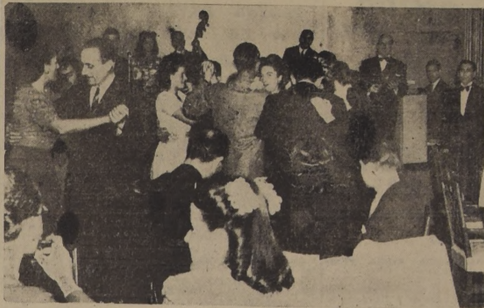
Aspecto parcial de la Boite "Millaray" del Hotel Carrera, cuya inauguración constituyó todo un acontecimiento social.