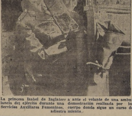
La princesa Isabel de Inglaterra a ante el volante de una ambulancia del ejército durante una demostración realizada por los Servicios Auxiliares Femeninos, cuerpo donde sigue un curso de adiestramiento.

Los informes recibidos indican que los alemanes lanzan granadas de mano cuesta abajo; muchos heridos norteamericanos se hallan en la falda de la montaña, y los camiones se encuentran imposibilitados para iniciar la evacuación de los heridos debido a la violencia del fuego.