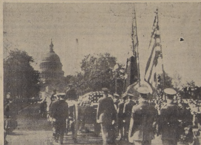
Con las tropas abriendo marcha, el féretro, que lleva los restos mortales del Presidente Roosevelt, envuelto en la bandera norteamericana, avanza hacia el Capitolio, poco después de iniciarse la solemne procesión desde la Estación de la Unión hasta la Casa Blanca.