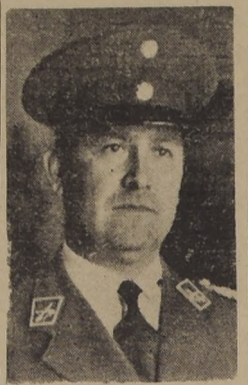
General don Eduardo Maldonado, Director General de Carabineros.