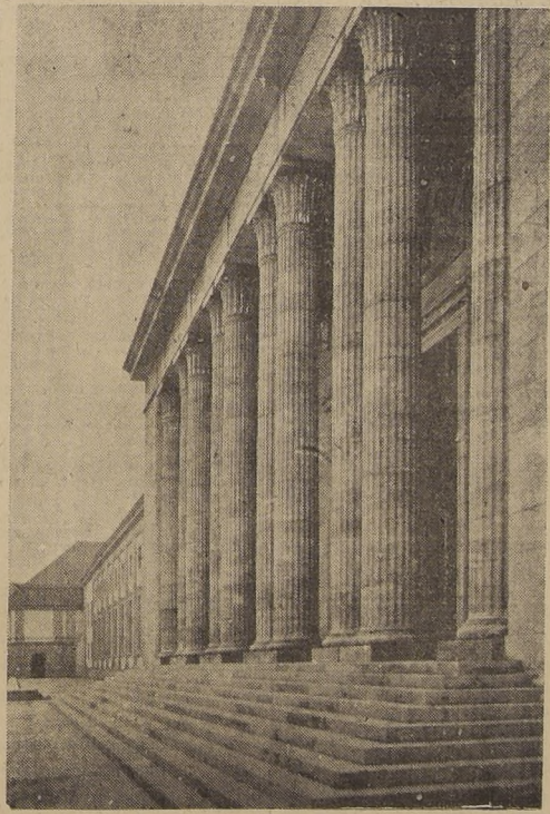
El edificio de la Cancillería del Reich, situado en el centro de Berlín, donde Hitler habría muerto combatiendo según la Radio de Hamburgo. Algunos círculos aliados, dudan de la verdad de esta noticia y se inclinan a creer que el ex Fuehrer fue asesinado o que simplemente ha buscado refugio en Noruega o Dinamarca. La radio británica ha declarado que los aliados exigirán después de la rendición incondicional, que los alemanes muestren el cadáver de Hitler como prueba de que realmente ha muerto.

Prepararon su muerte para proporcionar a los nazis un héroe mártir?— Conjeturas en Londres