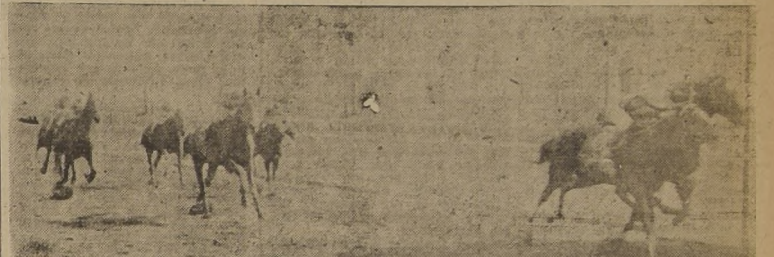
Nuestro favorito Contento domina estrechamente a Padre Negro, en la carrera principal del Hipódromo Chile. Tercero Secreto y cuarto Nilque

CHAULCO EN LA MEJOR SERIE Chaulco derrotó por media cabeza a nuestro recomendado Norfolk en la mejor serie de los compromisos de velocidad, gracias a que a éste le faltó un Heneke energético que lo hiciera emerger a fondo y que lo dominara durante el recorrido.