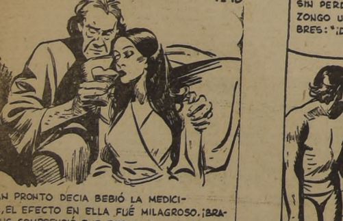
TAN PRONTO DECIA BEBÍ LA MEDICINA, EL EFECTO EN ELLA FUÉ MILAGROSO. ¡BRAKEUS COMPRENDIÓ QUE ESTABA SALVADA!

(1248) Cruel premio Por Edgar Rice Burroughs