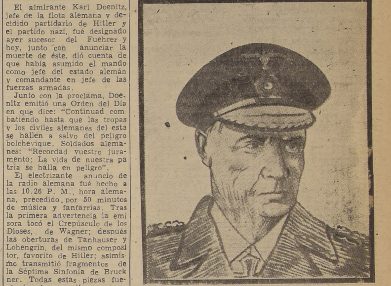
El Almirante Doenitz, Comandante de la Flota alemana, quien se ha hecho cargo del Gobierno supremo del Reich, por expresa disposición del ex Fuehrer.

El conde Bernadotte sonreía alegremente al ser recibido por su esposa e hijo, y dijo que esperaba salir de viaje muy pronto, aunque se abstuvo de indicar cuál sería su destino.