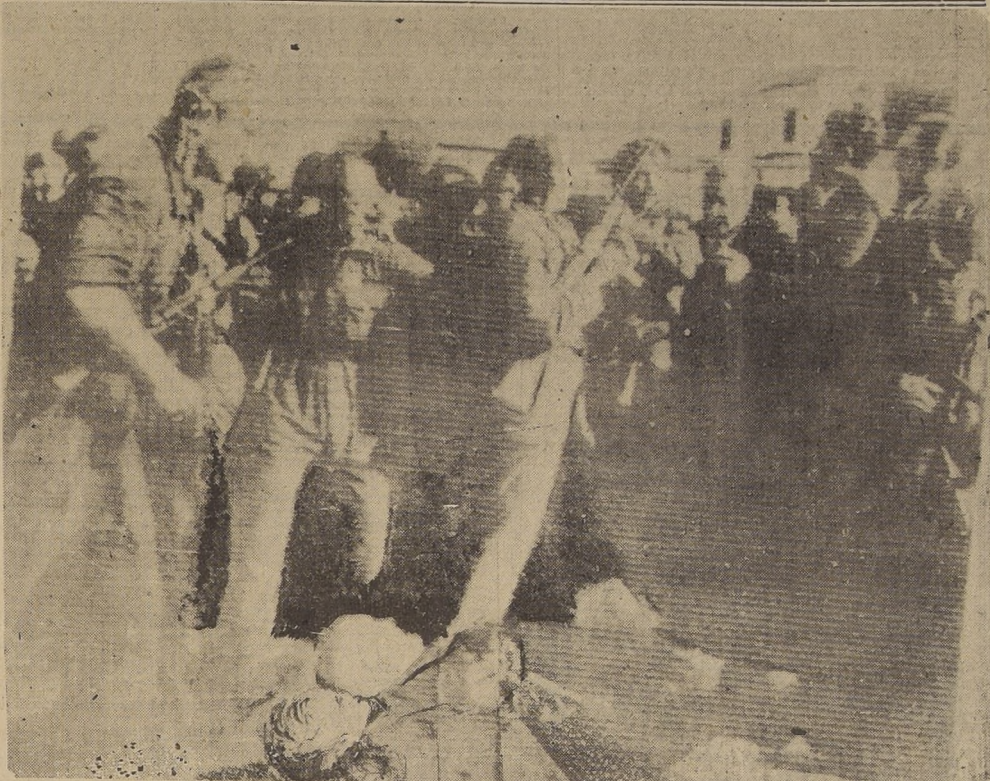
Esta impresionante fotografía, transmitida de Roma a Buenos Aires, muestra al que fuera todopoderoso Duce de Italia, momentos después de su ejecución en una plaza de Milán. A su lado reposan los restos de su amiga Clara Petacci, que trató de escapar con su cuerpo los disparos dirigidos contra el ex dictador. Las milicias populares luchan para contener la furia de la multitud que se lanza al asalto para despedazar a su ex ídolo.

Flanquearon Hamburgo.- Triple asalto contra la Fortaleza Alpina.- A 96 kilómetros de Berchtesgaden