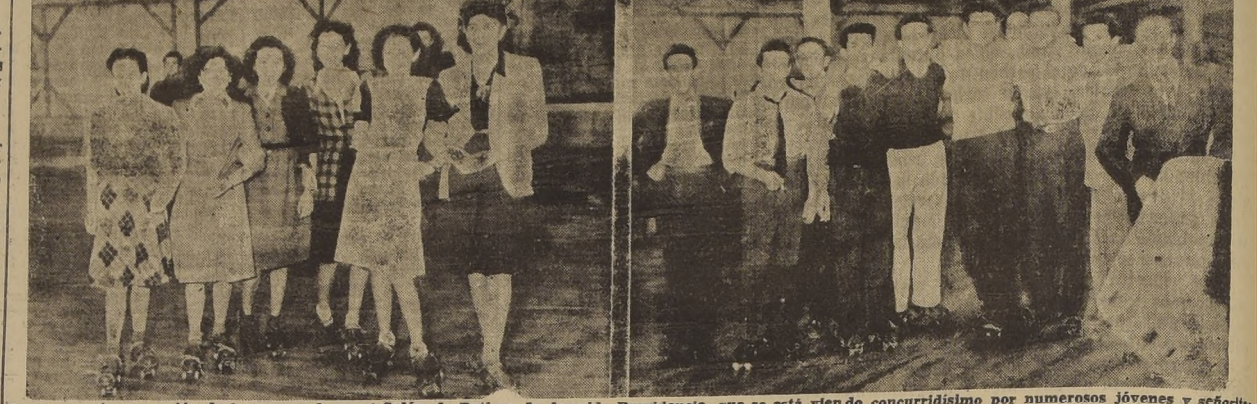
Durante la inauguración de la temporada en el Salón de Patinar de Avenida Providencia, que se está viendo concurrir por numerosos jóvenes y señoras de nuestra sociedad