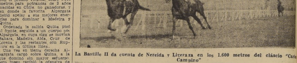
La Bastille II da cuenta de Nereida y Ligeraza en los 1.600 metros del clásico "Carlos Campino"