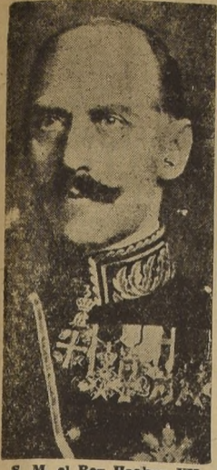
S. M. el Rey Haakon VII