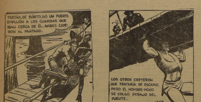
LOS OTROS CREYERON QUE TRATARIA DE ESCAPAR, PERO EL HOMBRE-MONO SE COLGO DEBAJO DEL PUENTE.