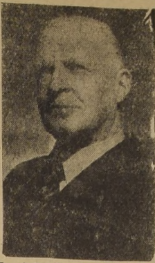
Sr. Arild Huitfeldt, Ministro de Noruega