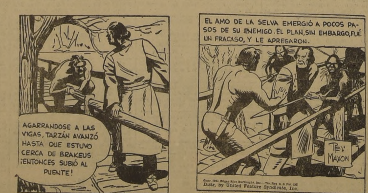
AGARRANDOSE A LAS VIGAS, TARZAN AVANZO HASTA QUE ESTUVO CERCA DE BRAKEUS CERCA DE BRAKEUS AL INTENTONCES SALTO AL PUENTE!