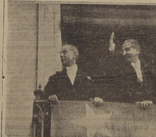
El Presidente de la República agradece las ovaciones del público desde los balcones de la Moneda. Está acompañado del Ministro subrogante del Interior y Relaciones señor Quintana Burgos y del Ministro de Defensa Nacional General Carrasco.

REGRESO A LA MONEDA Terminada la ceremonia en el Congreso, el Presidente de la República y Ministros de Estado regresaron a la Moneda, siempre por la calle Morandé y con los honores correspondientes que les rindieron las unidades del Ejército y de la Aviación.