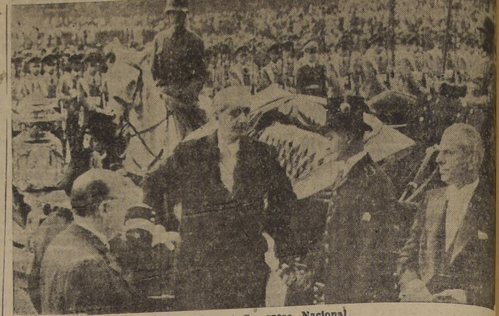
S. E. llega al Congreso Nacional.

Como ha ocurrido en otras ocasiones, con innumerables dificultades debieron tropezar ayer los periodistas para cumplir con su misión de informar al público en todos sus detalles, de la ceremonia de la inauguración de la Legislatura Ordinaria del Congreso Nacional.