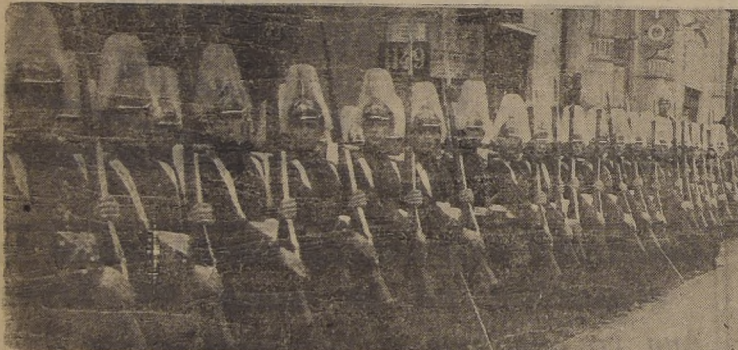
La Escuela Militar presenta armas al paso del Primer Mandatario.

sus Ayudantes y del Cuartel General de la Segunda División del Ejército, dió comienzo a la revista de las diversas unidades formadas a lo largo de la calle Morandé, Compañía y Catedral.