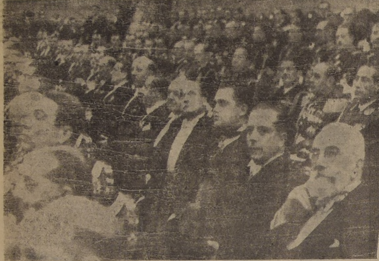
Parte de la numerosa concurrencia asistente al acto de ayer.

de la Escuela de Aviación rompió con los acordes del Himno Nacional, mientras los cadetes le presentaban armas.