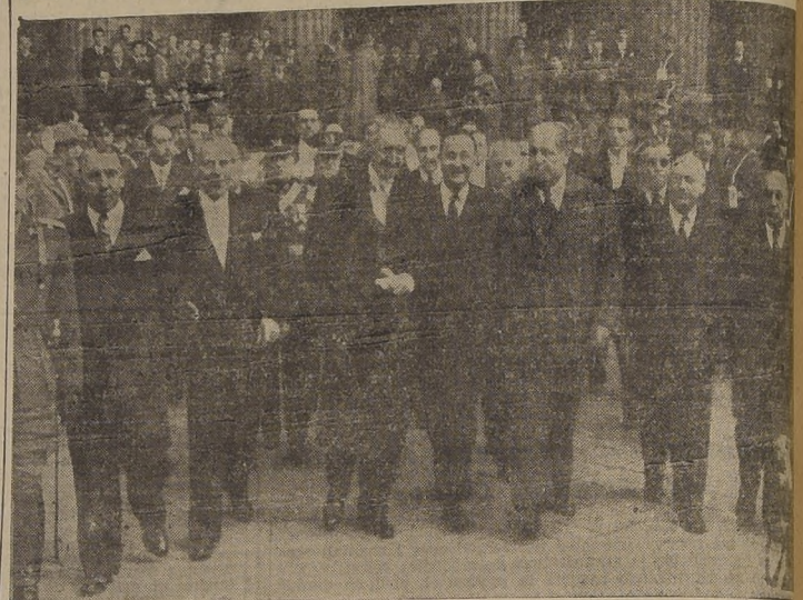
Terminada la ceremonia el Excmo. señor Ríos regresa a la Moneda.