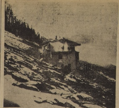
Las llamas hacen presa en el tercer piso de la casa que poseía Hitler en la ladera de una montaña nevada en Ober Salzburg Guardias negras (S. S.) prendieron fuego al edificio antes que las tropas americanas ocuparan la región.

Se espera que dos buques han sido reparados allí después de 17 días de trabajo.