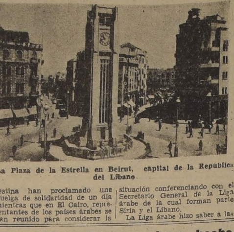
La Plaza de la Estrella en Beirut, capital de la República del Libano