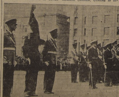
El Regimiento Escuela de la Fuerza Aérea rinde honores en los momentos en que el Excmo. señor Ríos se dirige a inaugurar la legislatura ordinaria.

RECIFTON EN LA MONEDA De 19 a 21 horas, se llevó a efecto en el Palacio de la Mo-