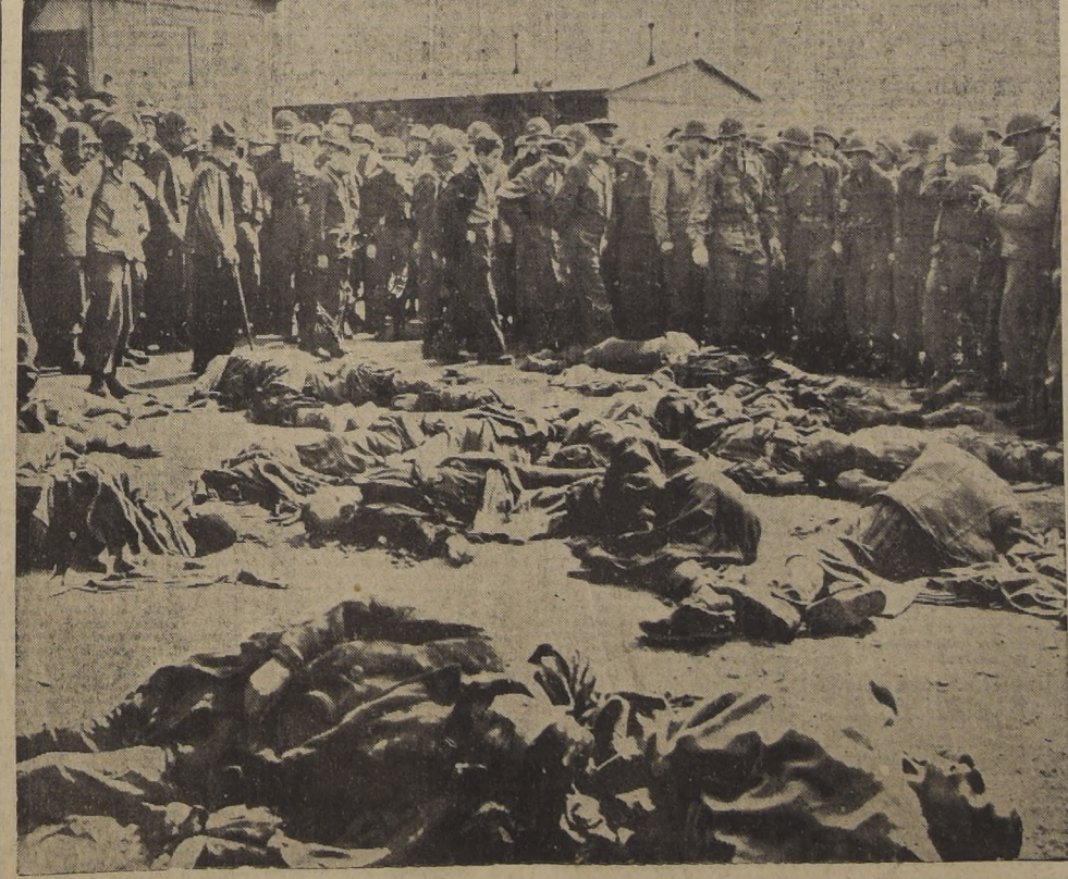
El Comandante Supremo de las fuerzas aliadas acompañado de altos oficiales, comprueba personalmente las atrocidades nazis en el campo de concentración de Gotha. El general Eisenhower, acostumbrado a presenciar con la más absoluta serenidad las más reñidas y sangrientas batallas, llegó a enfermar a la vista de los cuadros de horror que presentaba el campamento.