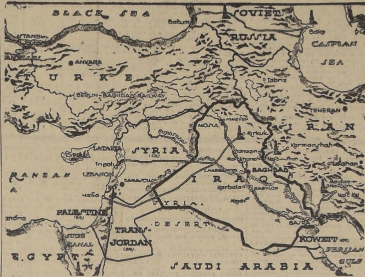
El Cercano Oriente, teatro de los últimos sucesos que han provocado la intervención británica para evitar la continuación del derramamiento de sangre entre las fuerzas francesas y sirias