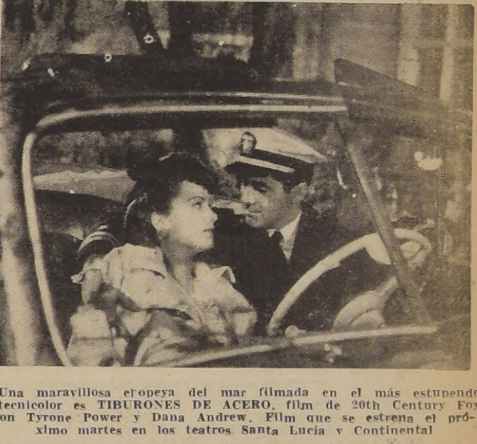
Una maravillosa proeza del mar filmada en el más estupendo tecnicolor es TIBURONES DE ACERO, film de 20th Century Fox con Tyrone Power y Dana Andrews. Film que se estrena el próximo martes en los teatros Santa Lucia y Continental