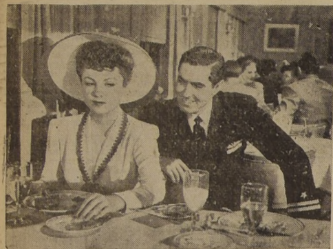
Un triunfo de la cinematografía en tecnicolor, es TIBURONES DE ACERO, film que obtuvo el premio de la Academia de Artes y Ciencias de Hollywood...

"TIBURONES DE ACERO", UN GRAN FILM DE TYRONE POWER, SE ESTRENA HOY EN LOS TEATROS SANTA LUCIA Y CONTINENTAL