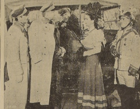
El próximo martes 12 se estrenará en el Teatro Santiago la divertida comedia LA HIJA DEL REGIMIENTO...