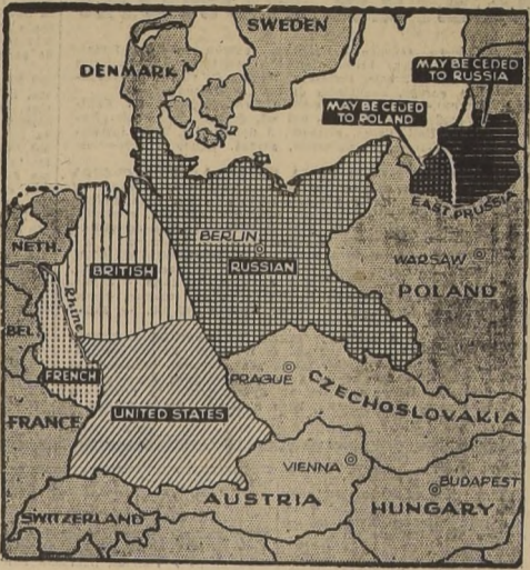
Posibles zonas de ocupación de Alemania

El ministro de Relaciones Exteriores, señor Macedo Soares, no rompió la tradición ya que la defensa continental interesa a todos los países del hemisferio, inclusive Brasil.