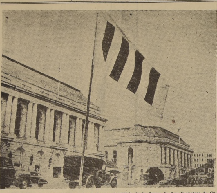
La bandera de las Naciones Unidas trémula frente al edificio de la Opera de San Francisco de California, donde sesiona la Conferencia. El pabellón aliado está formado por 5 barras rojas (que simbolizan las 4 libertades) sobre campo blanco que representa la paz.

Globos de papel lanzan nipones contra EE UU. SPOKANE (Estado de Washington), 6.—(U. P.).—El "Spokane Chronicle" publica un despacho aprobado por la censura, según el cual se ha utilizado en algunos casos aviones de caza para derribar globos de papel lanzados por los japoneses en los últimos meses contra la costa occidental.