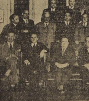
La Agrupación Patriótica Catalana ofreció anoche en el local del Centro Catalán de Santiago, una manifestación en honor del personal de Redacción de este diario...