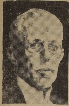
S. M. el Rey Gustavo de Suecia.

Hoy se celebrará el Natalicio del Rey Gustavo de Suecia.