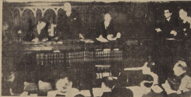
JUZGAN A LOS CRIMINALES DE GUERRA.— Vista general del Tribunal de Londres, donde se reúne la Comisión Aliada que juzga a los criminales de guerra. Preside el Muy Honorable Lord Wright (de pie).