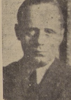
Joaquín von Ribbentrop, ex Ministro de Relaciones Exteriores del Tercer Reich

Fué descubierto en una pensión de Hamburgo por los ingleses