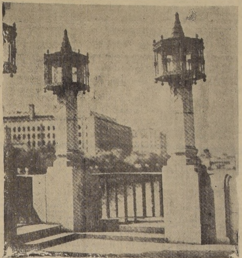
Un aspecto de Osaka, principal ciudad industrial del Japón

ISLA GUAM, viernes 15.—(U. P.)— El Comandante en Jefe de las Fuerzas Aéreas de los Estados Unidos, general Henry H. Arnold, anunció esta mañana que 520 superfortalezas estadounidenses descargaron 3.000 toneladas de bombas sobre Osaka. Es ésta la primera incursión de superfortalezas sobre el Japón desde el sábado pasado. El general Arnold dijo que se devastará al Japón con 1.800.000 toneladas de explosivos el próximo año. En este primer aniversario del primer ataque de superfortalezas contra el Japón, el general Arnold dijo que el programa para el año entrante será de completa y total destrucción del Japón industrial.