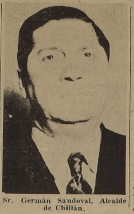
Sr. Germán Sandoval, Alcalde de Chillán.

DON GERMAN SANDOVAL SE ENTREVISTO CON EL MINISTRO DEL INTERIOR.— EDIFICACIONES PUBLICAS Y PARTICULARES.— AYER VISITO "LA NACION"