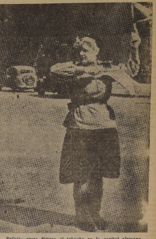
Policías rusas dirigen el tránsito en la capital alemana