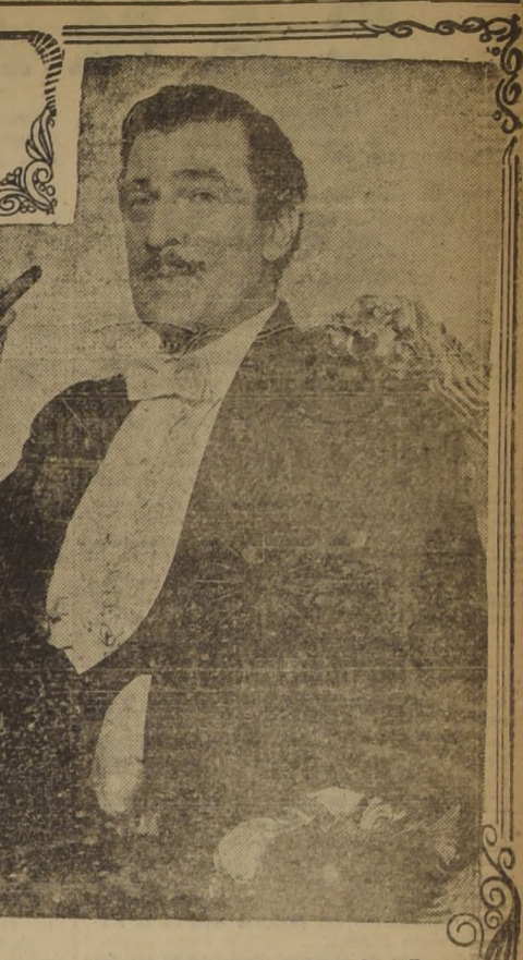
WALTER PIDGEON en la película M. G. M. "UNA GRAN DAMA".