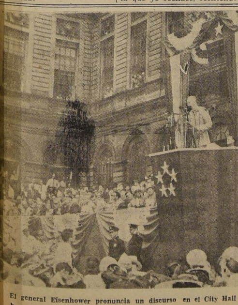
El general Eisenhower pronuncia un discurso en el City Hall de Nueva York

Wong me hizo las siguientes declaraciones: "La ciudad de Wanping, también llamada Lukouchiao se encuentra directamente al sudoeste de Peiping sobre el ferrocarril de Peiping a Han-Kow..."