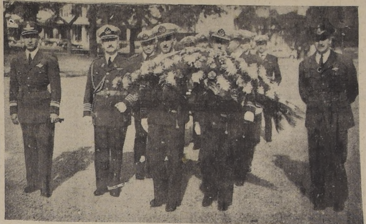
Los aviadores chilenos que fueron al país hermano en adhesión al Día de la Independencia rinden homenaje frente al monumento a O'Higgins