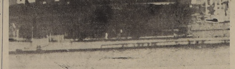
Vista parcial de uno de los submarinos gemelos al U-530