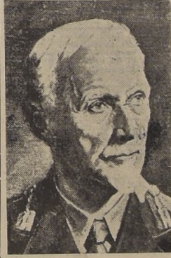
Mariscal Smuts, Primer Ministro de la Unión Sudafricana.

PRETORIA (Africa del Sur), 16. (UP).—El Mariscal Smuts llegó a ésta por vía aérea desde Egipto; dijo que no se había fijado fecha para la ratificación por la Unión del acuerdo de las Naciones Unidas y que no se había tomado una determinación de si habrá una sesión especial del Parlamento con ese fin.