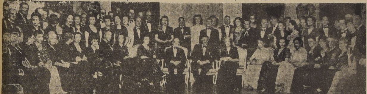
Asistentes a la brillante manifestación con que sus relaciones despidieron al Embajador de Gran Bretaña y Lady Orde, con motivo de su regreso a su país. Dicha manifestación consistió en un gran banquete en el Hotel Carrera