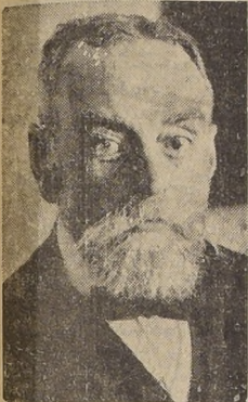
D. LUIS CLARO SOLAR

Desaparece el señor Claro Solar a los 88 años de edad, y cuando no obstante los achaques del tiempo, escribía los últimos volúmenes de sus "Exposiciones de Derecho Civil Chileno y Comparado", obra de importancia jurídica internacional.