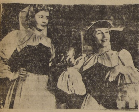
Libertad Lamarque y Eva Duarte aparecen en una escena de la más grandiosa epiopeta de la cinematografía argentina, "LA CABALGATA DEL CIRCO"...