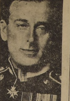
Almirante Lord Louis Mountbatten