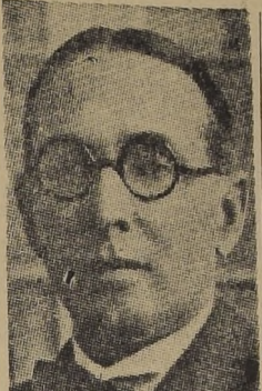
Señor Alfonso López

WASHINGTON, 19. (U. P.) — En los altos círculos oficiales de esta capital, ante la situación creada a Colombia con motivo de la renuncia del Presidente López se sustenta el criterio de que el gobierno colombiano resolverá sus problemas de índole política dentro de sus marcos constitucionales y de normalidad.