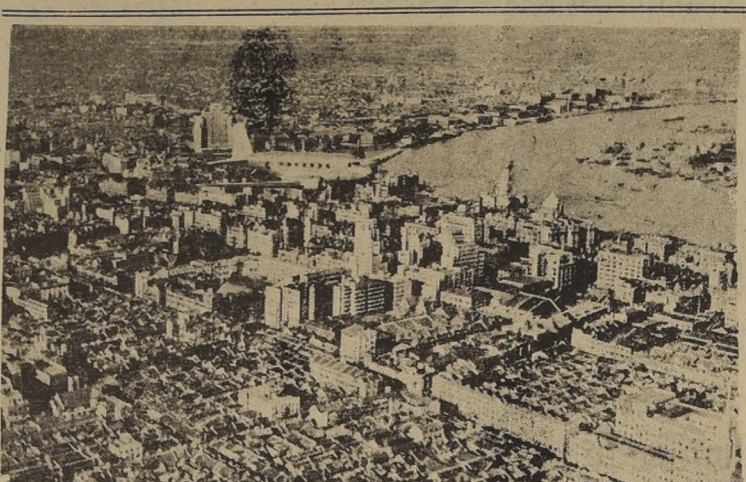
Una vista aérea del puerto chino de Shanghai

Más de 4.000 tons. de bombas lanzaron las Fortalezas sobre sus objetivos