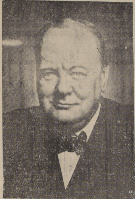
Mr. Winston Churchill, Primer Ministro de Gran Bretaña desde el 11 de mayo de 1940 hasta el 26 de julio de 1945. Es probable que Mr. Churchill renuncie al Parlamento y que el Rey lo designe Par del Reino con el título de Duque de Londres. Esto nombramiento lo hara ingresar a la Cámara de los Lores, por derecho propio.

Dijo Churchill en su mensaje de agradecimiento y despedida al pueblo inglés