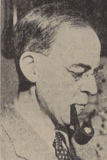
Sir Stafford Cripps