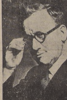
Mr. Herbert Morrison

BREVE DISCURSO DE ATTLEE Hecho el silencio, el Primer Ministro británico dijo a la muchedumbre: "Es ésta la primera vez en la historia de este país que un Gobierno laborista, con una política socialista, ha recibido la aprobación del electorado." "Tenemos ante nosotros una gran tarea: el pueblo ha puesto su confianza en el Partido Laborista. No será un partido depositada en vano!" "Enfrentemos las tareas que no esperan, sin desistimar sus dificultades, pero sabiendo que tenemos el firme propósito de vencerlas." ANTES QUE TODO, LA DERROTA DEL JAPON "Antes que todo tenemos que terminar la guerra contra el Japon, y pensamos en este momento en nuestros muchachos que combaten en ultramar. Cuidaremos que reciban todo el apoyo que necesitan". Luego, refiriéndose a la política del Partido, Attlee continuó: "Nosotros (los socialistas) formamos un gran movimiento internacional. Tenemos una política a la que hemos mantenido nuestra adhesión a través de los años. Sus principios son sencillos: la fraternidad entre los hombres." "Deseamos una seguridad que destierre para siempre la guerra; deseamos una amplia prosperidad entre todos los pueblos y naciones de la tierra, y deseamos la más amplia cooperación con todos los demás pueblos." "Aquí, en el país, tenemos también grandes tareas; hemos de curar las heridas de la guerra y reconstruir nuestras ciudades."