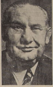
Mr. Ernest Bevin

Declaró el nuevo Primer Ministro inglés en un discurso.- Palabras de Morrison, Laski y Bevin