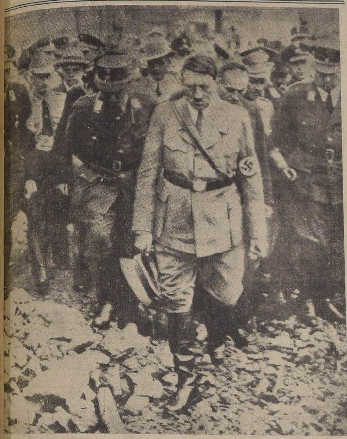
La presente es una de las últimas fotografías de Adolfo Hitler. Aparece durante una inspección de las ruinas de una ciudad alemana alcanzada por bombas anglo-norteamericanas.

Fueron destruidas o averiadas otras sesenta unidades navales enemigas