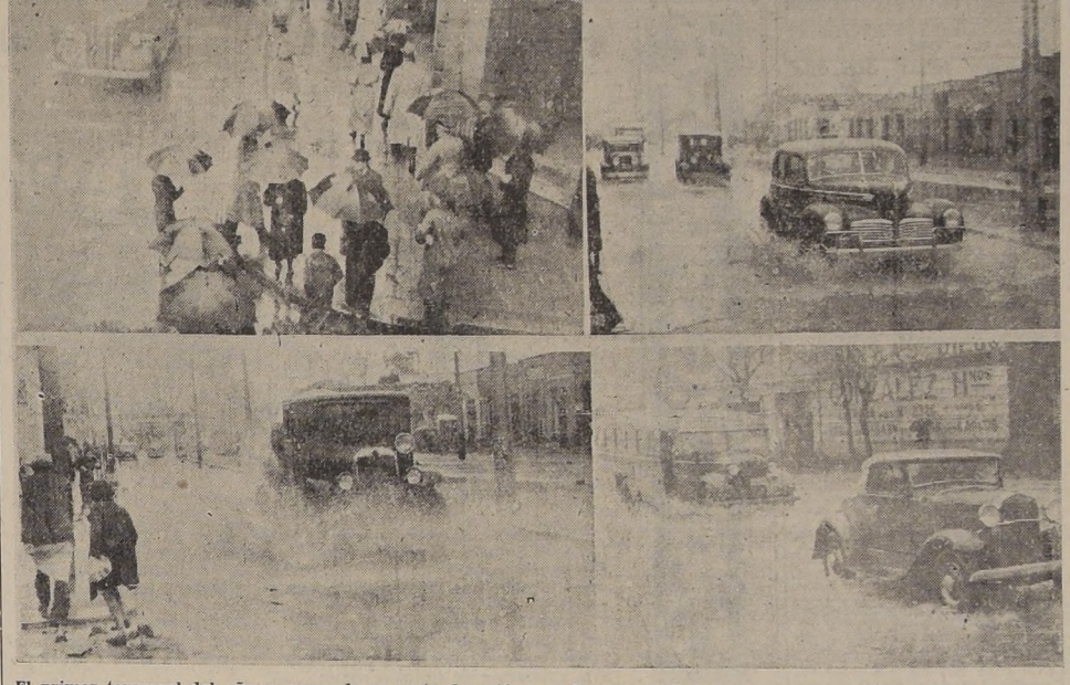
El primer temporal del año, a pesar de su corta duración, produjo un verdadero trastorno en esta capital, repitiéndose en varios de sus principales barrios las ya clásicas inundaciones. Aquí vemos algunos aspectos de la Gran Avenida y del barrio alto, en los momentos en que la lluvia alcanzaba su mayor violencia.

NOMBRE DE ROOSEVELT A UNA AVENIDA DE LA CIUDAD DE P. ARENAS El Ejecutivo envi6 ayer un mensaje al Congreso Nacional, por medio del cual somete a su aprobación un proyecto de ley que contempla el cambio de nombre de la actual Avenida República de la ciudad de Punta Arenas, de la provincia de Magallanes, por el de "Avenida Franklin Delano Roosevelt".