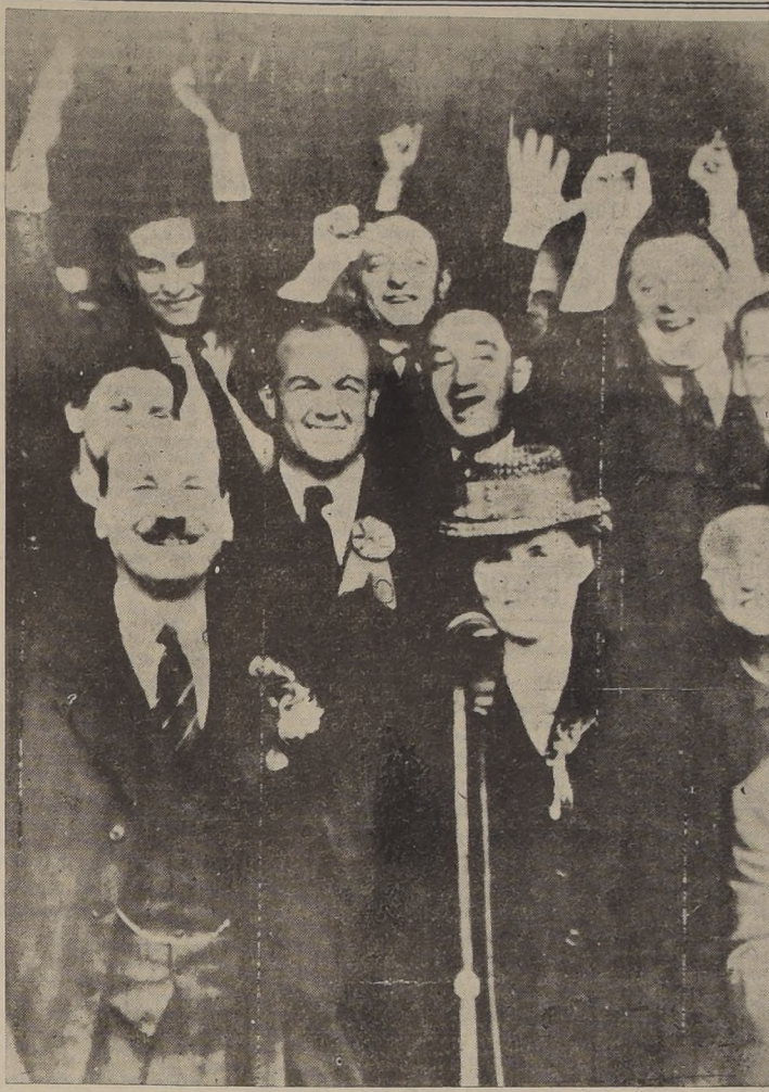
Con una amplia y victoriosa sonrisa, Mr. Clement Attlee aparece en la fotografía que fué tomada después de conocerse los resultados de las elecciones británicas...

Se anticipa que hoy a últimas horas se emitirá un comunicado simultáneo en Moscú, Londres, Washington y posiblemente en Berlín