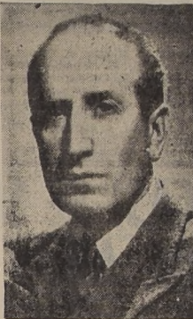
forme al Excmo. señor Ríos acerca de sus actividades en el extranjero.