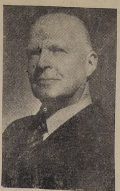
Excmo. señor Arild Huitfeldt, Ministro de Noruega en Chile.