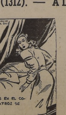
ASICIA, AL DIR PASOS EN EL CO-REEDOR, UN PANICO ATROZ SE APODERO DE ELLA.