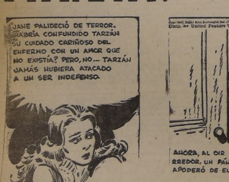
JANE PALICEDIO DE TERROR, MADRIA CONFUNDIRA TARZAN SU CUIDADO CARIZOSO DEL ENFERMO CON UN AMOR QUE NO EXISTIA? PERO... TARZAN JAMA HUBIERA ATACADO A UN SER INDEFENSO.