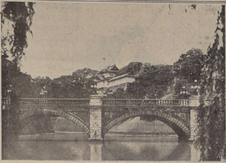
El puente de Niubashi en la entrada principal del Palacio Imperial