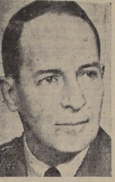
General Mac Arthur designado comandante en jefe de las fuerzas aliadas que ocuparán el Japón

MANILA, 15.—(U. P.). El General Mac Arthur envió un mensaje radial al Emperador Hirohito, pidiéndole que los japoneses se pongan en contacto con el para la cesación de las hostilidades en la fecha más próxima posible.