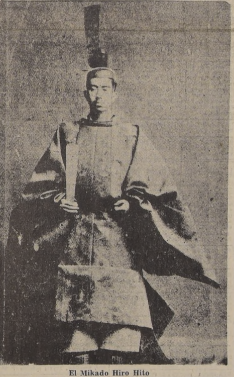
El Mikado Hiro Hito

SAN FRANCISCO, 14.—(U. P.). Por primera vez en la historia del Japón, el emperador Hirohito dirigió la palabra a su pueblo por radiotelefonía para informarle que acepta las disposiciones de la declaración conjunta de las cuatro potencias aliadas en Potsdam.