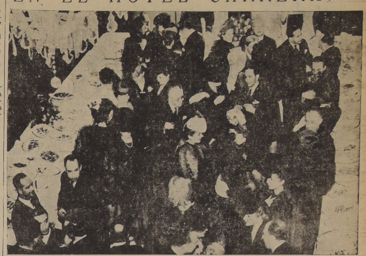
Aspecto de uno de los salones de Hotel Carrera, en la que puede apreciarse parte de los asistentes al cocktail ofrecido en honor del Excmo. señor Ministro de Francia...