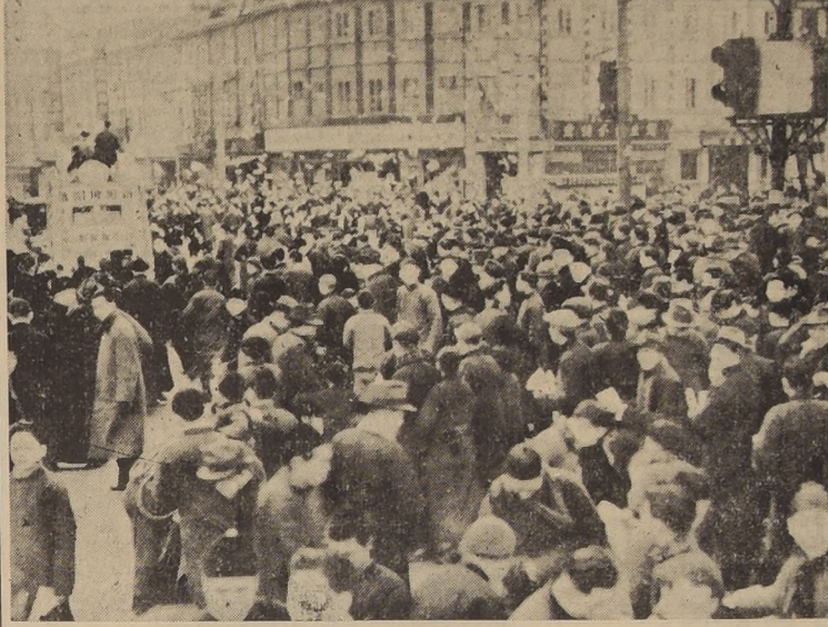
Escena captada en Singapur cuando se dió a conocer la capitulación del Imperio japonés