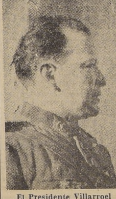
El Presidente Villarroel

ASUNCION, 10. (U. P.)—En el aeródromo de Campo Grande, fué objeto de un cálido recibimiento el Presidente de Bolivia, Villarroel, quien llegó a bordo de un trimotor militar acompañado de cuatro de sus Ministros y de varios jefes del Ejército.