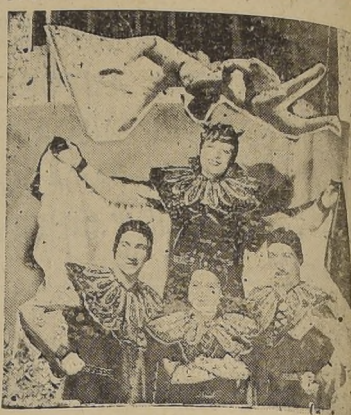
Ver a los audaces trapeceistas The Flying Decias (Los Cuatro Diablos Rojos), que son la atracción de más relieve en el elenco del Circo Flying Behrs...

HOY EN FUNCION NOCTURNA A LAS 9.45 EN EL ESTADIO CHIL