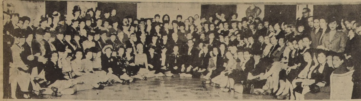
Asistentes al almuerzo ofrecido ayer en el Hotel Carrera, por las Visitadoras Sociales de la capital a las Delegaciones que visitan Santiago, con ocasión de celebrarse el Primer Congreso Panamericano de Servicio Social.

MASTILES DE BANDERAS Tornería "El Cóndor" CONDOR 1380