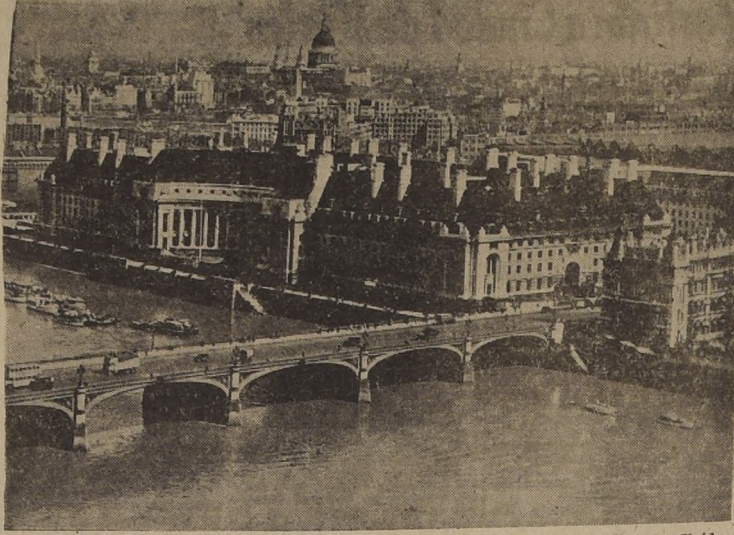
Londres, sede de la Conferencia de los Ministros de Relaciones de Gran Bretaña, Estados Unidos, Francia, Rusia y China.

CABALLERO AMERICANO de 25 años, inteligente, culto y poseedor de los dos idiomas, español e inglés, desea conseguir empleo como intérprete en alguna agencia de turismo u hotel de primera clase. Dirigirse: BOX (APTO AEREO) 1239, Cristóbal, Canal Zone