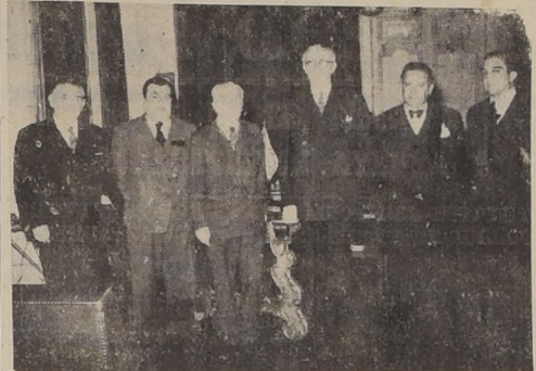
Los dirigentes de la ANEF, durante su visita a S. E.

SU INTERES POR LA DICTACION DEL ESTATUTO ADMINISTRATIVO Y DEL REAJUSTE DE SUELDOS