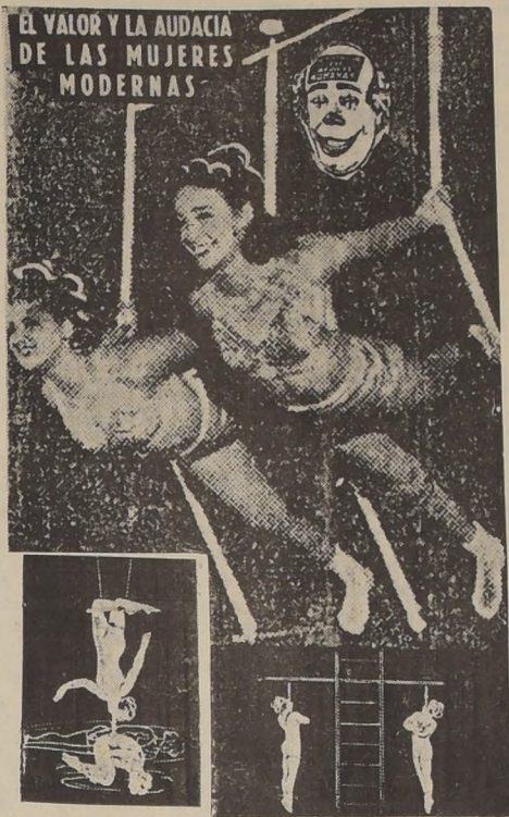
EL VALOR Y LA AUDACIA DE LAS MUJERES MODERNAS

El Domingo 23 en el Caupolicán habrá tres distintos e importantes espectáculos del Nuevo Circo Las Aguilas Humanas, matinee infantil a las 2.30 de la tarde; vermouth a las 6.14 y nocturna a las 9.40.