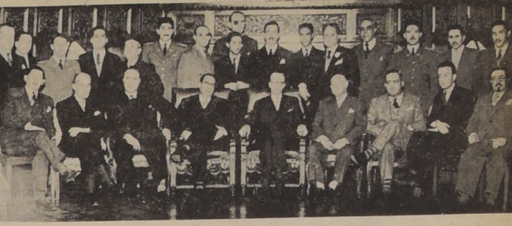
Grupo de asistentes al cocktail que la Revista "Ecuador en Chile" dió en honor de los alumnos del Colegio "Vicente Rocafuerte" de Guayaquil...