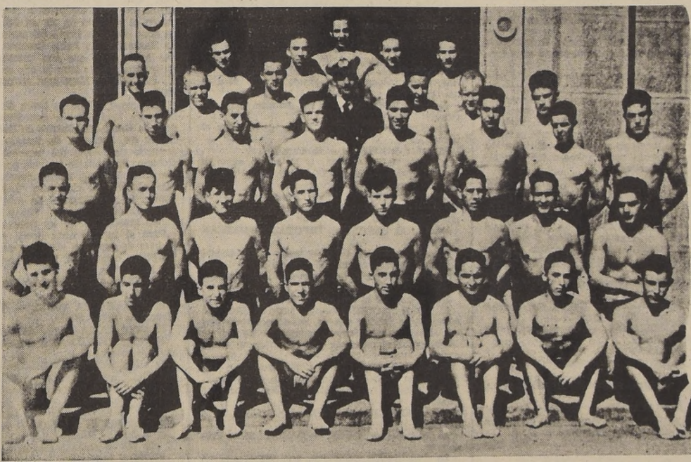
NATACION.—Equipo que representará a la Escuela Naval en la Olimpiada Militar que se inicia mañana en el Estadio Nacional. Los preparativos hechos y el entusiasmo de los participantes hacen pensar que bien puede resultar el mejor espectáculo deportivo del año.

CORTE DE APELACIONES Primera Sala. Relator: señor Buzasquiere. 1 c) A. Tapia, revocada; 2 c) O. Bustamante, confirmada; 3 c) M. Sarmiento, confirmada; 4 c) A. Hernández, confirmada; 5 c) A. Hernández, confirmada; 6 c) R. Lizana, confirmada; 7 c) J. Barrera, confirmada; 8 c) R. Peralta, confirmada; 9 c) L. Godoy, confirmada; 10 c) N. Adams, confirmada; 11 c) O. Opazo, confirmada; 12 c) E. F. Barreira, confirmada; 13 c) F. Sullit, con M. Núñez, desierta; D. Tobar con H. Muriello y otro, sin lugar deserción.