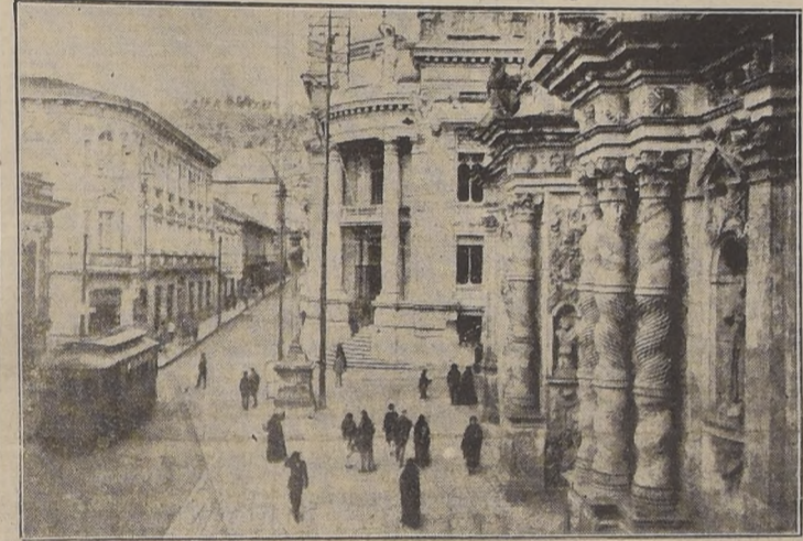
Una calle central de la metrópoli ecuatoriana

Ambos mandatarios conferenciaron con gran cordialidad antes de la partida