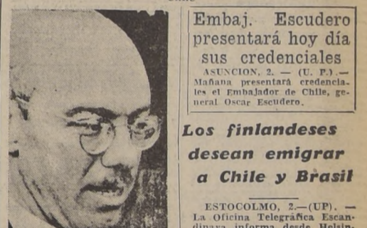
El Presidente Velasco Ibarra

Así lo hacen los ecuatorianos que vienen a Chile".