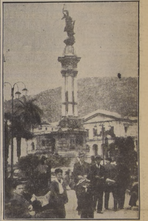
El Monumento a los Héroes de la Independencia, al pie del cual el Cabildo de Quito rindió homenaje al Presidente de Chile

Alumnos de las escuelas cantaron la Canción Nacional chilena que el Presidente Ríos aplaudió emocionado. El presidente del Concejo hizo una corta alocución y entregó al Presidente chileno una llave de oro de la ciudad.