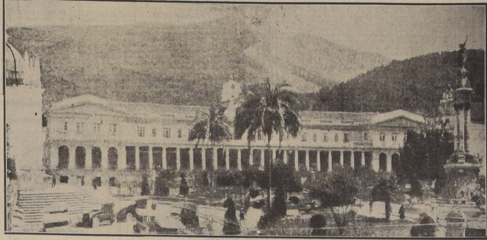
La Plaza de la Independencia y el Palacio del Gobierno en la capital del Ecuador

AGUAS COLONIA DESDE $15.—EL LITRO LOCIONES EXTRACTOS A GRANEL Y TODOS ARTICULOS DE BELLEZA Y TOCADOR A PRECIOS MAS BAJOS EN LA NUEVA PERFUMERIA SWEET MERCED 763 AL LADO DEL HOTEL ESPAÑOL.