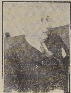
Don Augusto Barcia

SU PERSONALIDAD Tuvimos oportunidad de charlar durante algunos instantes con el señor Barcia, en una audiencia que otorgó en la tarde de ayer a los periodistas en el Hotel Carrera. Se mostró reservado en sus declaraciones a la prensa. Se excusó de opinar sobre el Gobierno del Coronel Perón, por considerar que ha recibido la mejor hospitalidad en la República Argentina, pero reconoció que hay muchos "Perones" en el mundo, entre otros el propio Franco. Fue Ministro de Relaciones del Gabinete de Azaña. Cuando de este se retiró el Gobierno ocupó el cargo de Primer Ministro de la República. Fue elegido Diputado a Cortes por Almería. Formó parte del Ministerio de José Giral, de 19 de julio al 5 de septiembre de 1936. Luego fue nombrado Embajador ante el Gobierno de Uruguay. Cuando se embarcaba en Amberes rumbo a América, se suspendieron las relaciones con la España Re-