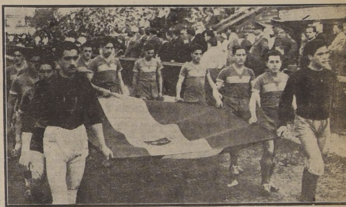
UNIVERSIDAD DE CONCEPCION. — Desfilan los sureños frente a la tribuna oficial. Su actuación fué notable perdiendo, como era lógico, ante uno de los buenos cuadros profesionales de la capital.

ADHESION DEL CLUB SUPLEMENTEROS En el descanso del encuentro de fondo, un grupo de atletas del Club Suplementeros, rindió