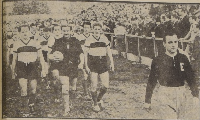
UNIVERSIDAD CATOLICA. — El conjunto dueño de casa se vió en apuros para derrotar a los penquistas, y tuvo que apelar a todos sus titulares para no sufrir un contraste inesperado. Lago y Riera destacaron.