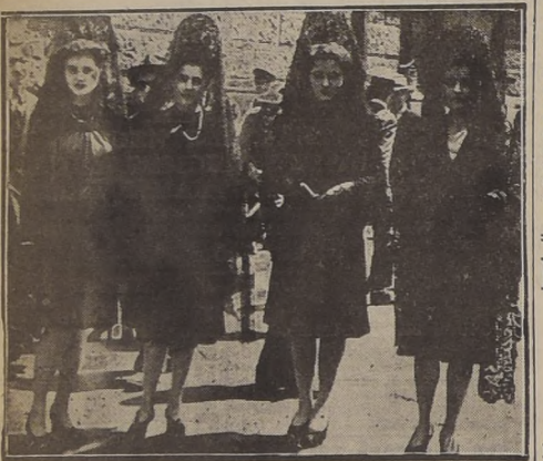
Damas españolas que asistieron con sus clásicas mantillas al Te Deum de ayer.