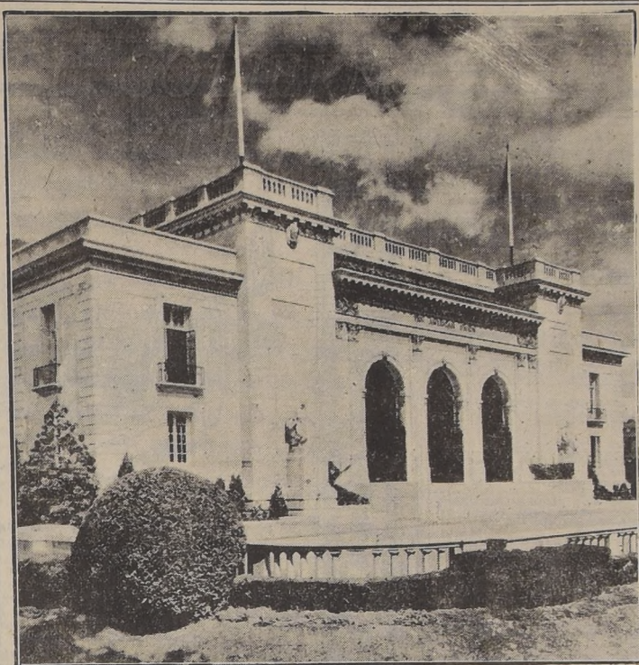
El edificio de la Unión Panamericana en Washington.

La United Press no ha podido encontrar ninguna fuente responsable que dé noticias al respecto y esta noche el jefe de (PASA A LA PAG. 6)