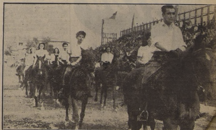
EQUITACION. — Todas las ramas deportivas del club que desde ayer tiene Estadio propio, se presentaron correctamente. Aquí vemos a los equitadores, amazonas y jinetes.