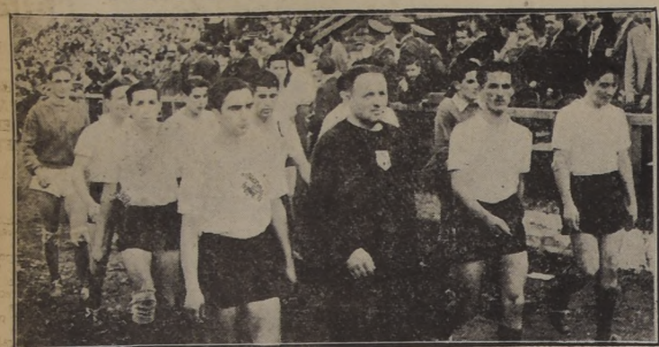
UNIVERSIDAD SANTA MARIA.— El equipo de fútbol de los porteños que, cumpliendo una performance contradictoria, cayó fácilmente vencido por el de la Universidad de Chile, con el score de 3 a 1.