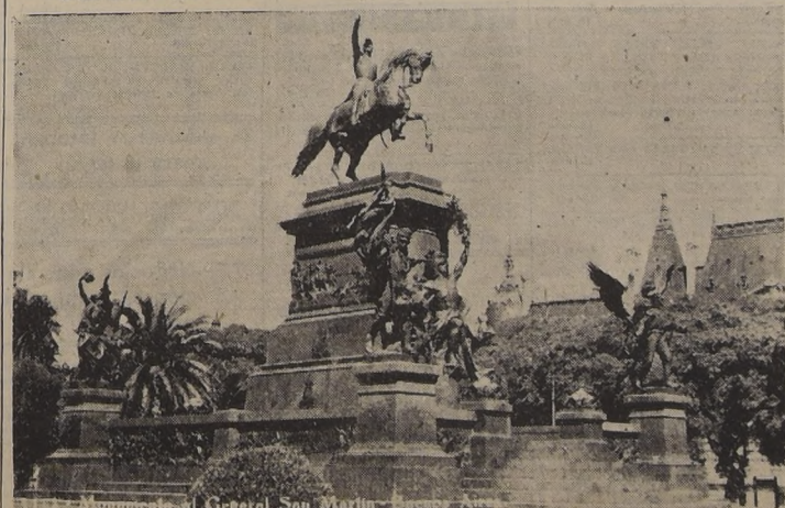
La Plaza y el monumento a San Martín en Buenos Aires

Movilización especial de micros hasta la Exposición, y servicio extraordinario de tranvías.