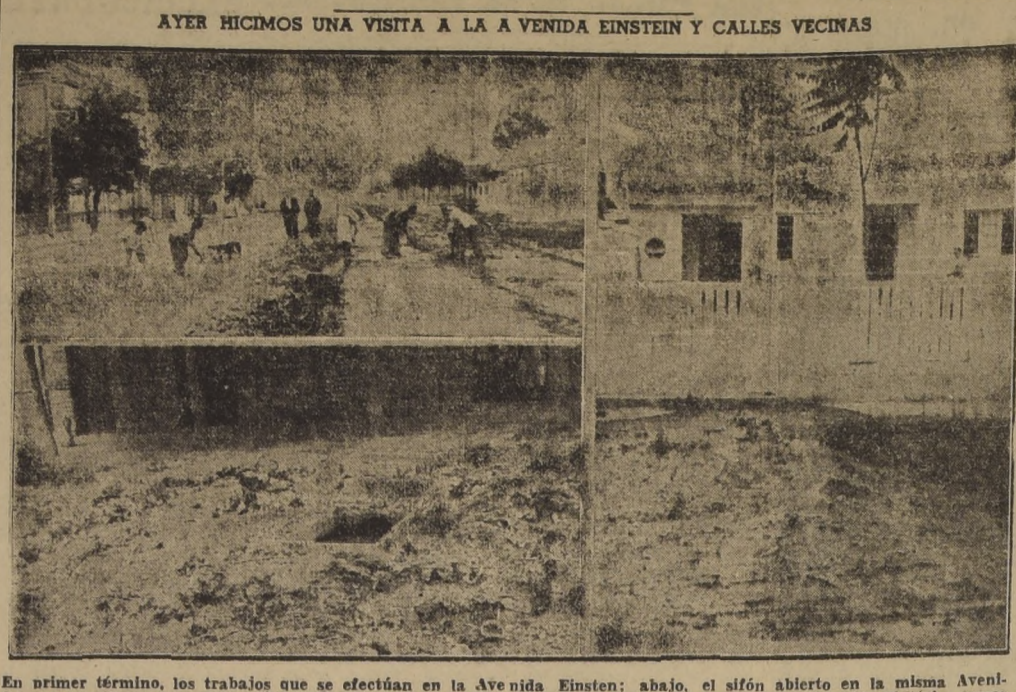
AYER HICIMOS UNA VISITA A LA AVENIDA EINSTEIN Y CALLES VECINAS