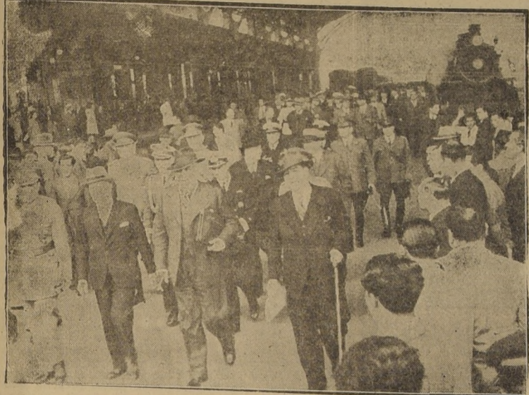
El Excmo. señor Duhalde a su llegada a la Estación Alameda. Fué recibido y saludado por Ministros de Estado, jefes de las Fuerzas Armadas, funcionarios y numeroso público.

Ayer, a las 10.46 horas, llegó de regreso a Santiago el Vicepresidente de la República, Excmo. señor Alfredo Duhalde Vásquez, después de haber realizado una triunfal gira por Osorno, Valdivia y Río Negro.