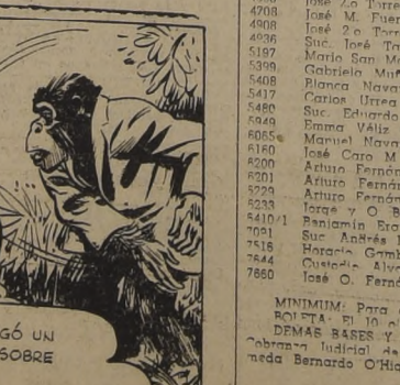
RENEE, DESPERADA, HIZO UN SEGUNDO DISPARO.