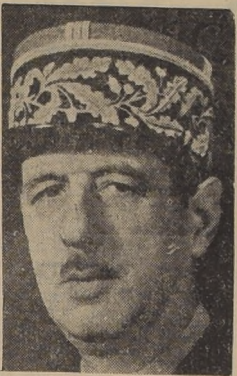
General De Gaulle

PARIS, 19. (U. P.).—Mientras la Asamblea estaba reunida discutiendo la situación política, se efectuaron en París varias manifestaciones en favor del general De Gaulle, a pesar de la expresa petición del Ministerio del Interior que hizo un llamado "al patriotismo de todos" en un comunicado especial, para que no se hicieran demostraciones.