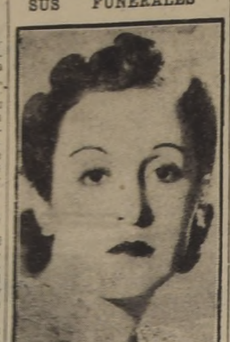
Ayer en la madrugada dejó de existir en el Ferrocarril de Escondido...

PERTENECIO AL PERSONAL ADMINISTRATIVO DE 'LA NACION' SUS FUNERALES