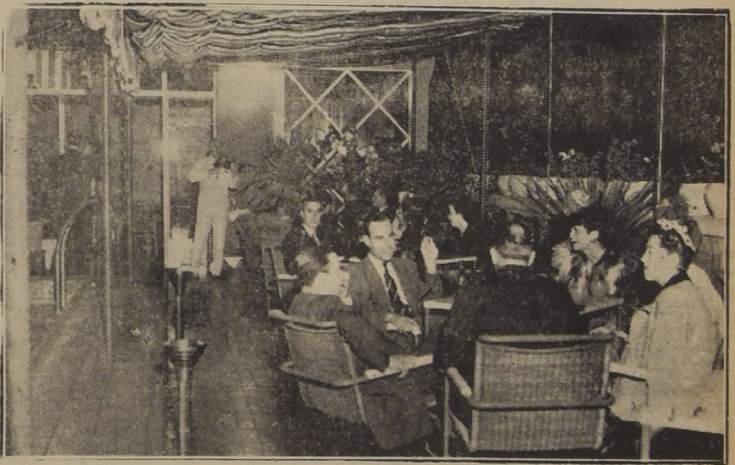
Aspecto parcial de "Florida", la piscina en el 17.º piso del Hotel Carrera, cuyo local se ve prestigiado a diario por una numerosa y distinguida concurrencia