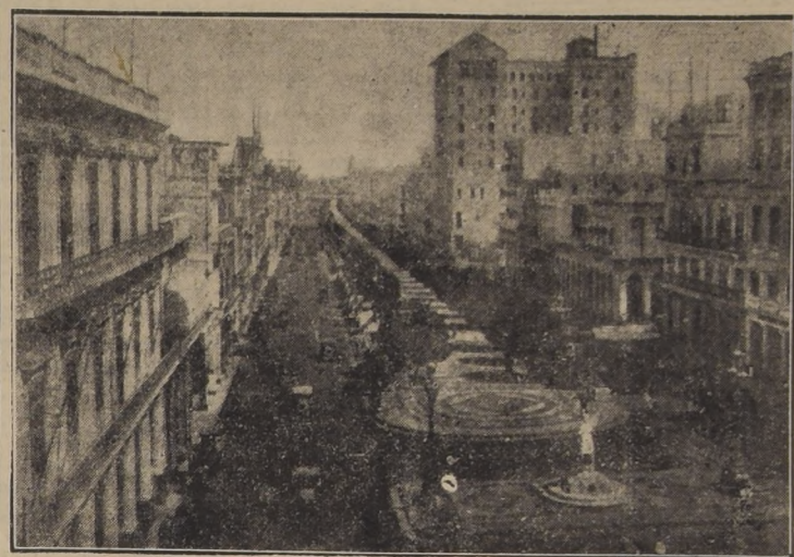
El Paseo Martí, en La Habana