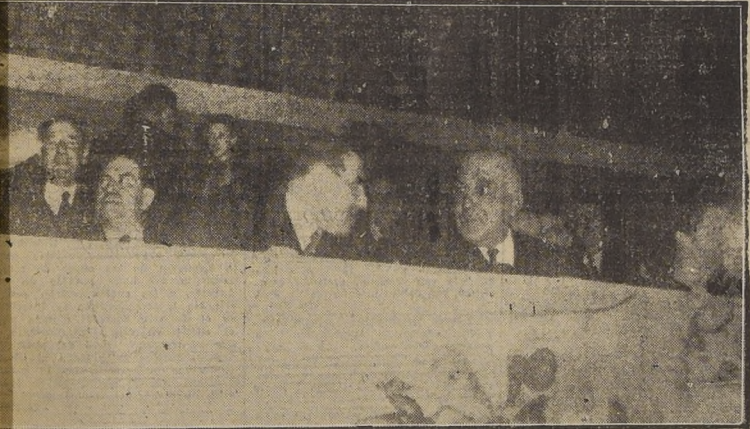
EL EXCMO. SEÑOR DUHALDE.— El Vicepresidente de la República, Excmo. señor Alfredo Duhalde Vásquez, presencia el espectáculo. El Excmo. señor Duhalde fué muy aplaudido a su llegada al Estadio Nacional.

mayor trascendencia deportiva que pueda presenciarse en el año. En comparación con los "clásicos" anteriores, desde su implantación, debe decirse, sin embargo, que el de esta vez no alcanzó los atractivos esperados, sea porque las innovaciones del espectáculo fueron pocas, por las deficiencias de los números del programa, o porque el match no llegó a adquirir aquellos contornos tendidos y de marcada emotividad que es de esperar de dos rivales semejantes. Alejados del triunfo que obtuvo la Universidad de Chile en la cancha —por dos goles a cero— y también en las "barras", conviene destacar la repetición de aquellos aspectos que constituyen la animación de esta fiesta de estudiantes, y que el público acepta porque va dispuesto a todo, y porque la ansiedad con que aguarda lo predispone con generosidad a emitir un juicio, si así se le exigiera. Pero es de rigor declarar que, dentro del mismo clima que preside esta clase de reuniones, bien sus organizadores podían explotar otros temas de mayor alcance y provecho, y que seguramente hallarían igual o superior aceptación en esa muchedumbre que siempre da la impresión de esperar algo nuevo y mejor. Los números bufos, los cánticos alusivos y el empuje