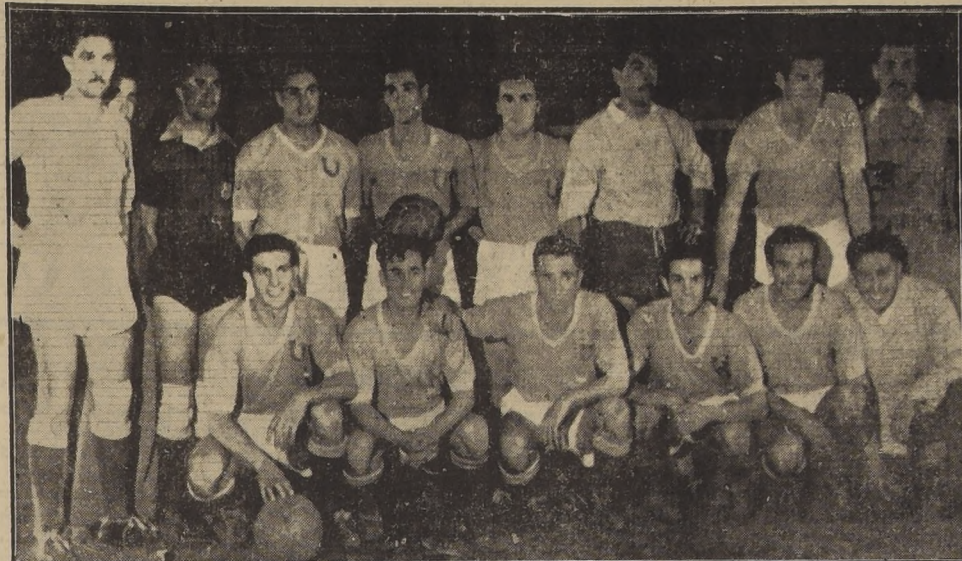
VENCEDORES.— Integrantes del cuadro profesional de la Universidad de Chile, que anoche en el match oficial del campeonato se impuso al de la Universidad Católica por 2 goles contra 0.

constante que cada "barra" presenta a su equipo, con muy ligeras variantes, son los mismos y la diferencia que pudiera existir estriba tan sólo en el mayor ingenio que de su parte pongan para dar una sensación más fuerte al que va a gozar de un rato de expansión y de solaz. Creemos, sin el ánimo de aludir al poco éxito del "clásico" de anoche, que para más de alguien pudo ser una cosa evidente, que la presentación de danzas de niñas, de bailes típicos, de canciones, de coros a distintas voces, de recitaciones, y cuanto de valor artístico y educacional pudiera explotarse en un festival de esta magnitud —son 60 mil personas las que lo presenciaron— también podrían dar motivo a un "duelo" entre los alumnos que animan el partido de fútbol, que sostienen las Universidades. El espectáculo no perdería su carácter festivo y alegre, pero se otorgaría, a manera de conclusión, una satisfacción más de acuerdo con la naturaleza y la cultura, propias de quienes organizan una cosa así. El exceso de fuegos artificiales, con sus deficiencias mecánicas y con su repetición, estamos ciertos que no ha significado algo de valor, motivo de éxito, sino que, por el contrario, bien puede traducirse en una amenaza para el brillo de los futuros "clásicos" universitarios. Con respecto al match, en