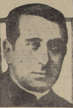
MONSEÑOR MIGUEL MILLER

DATOS BIOGRAFICOS DEL EXTINTO El distinguido prelado nació en Santiago en 1879. Hizo sus estudios teológicos en el Seminario de Santiago, siendo ordenado sacerdote en 1902. Durante muchos años ejerció el magisterio en el ramo de Religión y de Filosofía. Fue profesor de la Escuela Militar, establecimiento del Liceo N.º 4 y del Instituto Nacional. Conoció su obra sobre conocimientos elementales de Filosofía que usaba en numerosos establecimientos de Educación Secundaria. El señor Miller desempeñó además las funciones de Capellán de la Escuela Militar, establecimiento en el cual supo conquistarse el aprecio de oficiales y cadetes. Desde 1910 hasta 1925 fue secretario del Arzobispado don Crescencio Errázuriz, con quien colaboró íntimamente en la dirección de la Iglesia de Chile. En 1925 fue nombrado Monseñor Miller, Vicario General del Arzobispado, cargo que desempeñó hasta el día de su muerte. Poseía los títulos de Canónigo, otorgados en 1917 y de Medallero Doméstico de S. S. que le fué conferido en 1927, y el de Comendador de la Orden de Isabel la Católica.