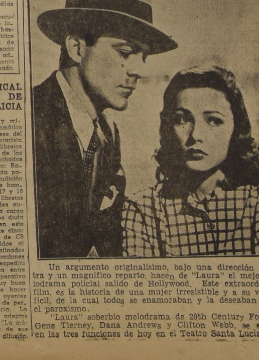
Un argumento originalísimo, bajo una dirección maestra y un magnífico reparto, hacen de "Laura" el mejor melodrama policial...