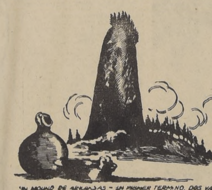
UN MOUND DE AERAZAS - UN PREMIER TERRAIN, DES MOUND.