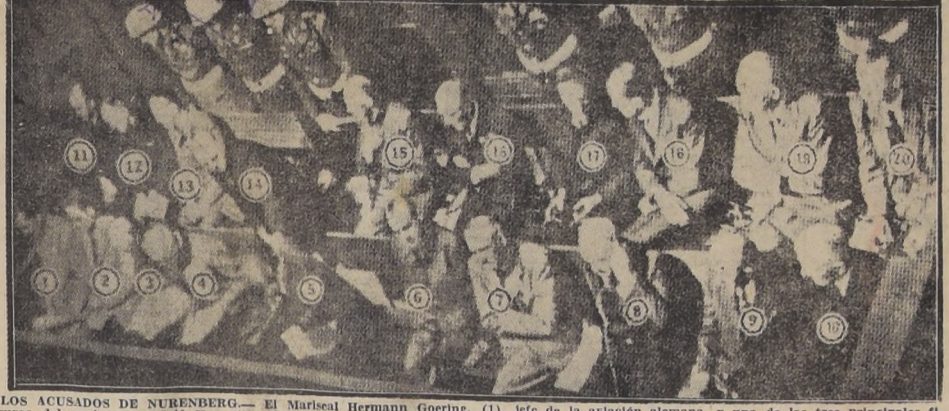
LOS ACUSADOS DE NUREMBERG.— El Mariscal Hermann Goerring (1), jefe de la aviación alemana, y una de las tres principales figuras del nazismo; Rudolf Hess (2), designado sucesor de Hitler hasta su infortunado viaje a Inglaterra, antes de la agresión contra Polonia... [The caption lists the names of the defendants and their roles in the Nazi regime.]