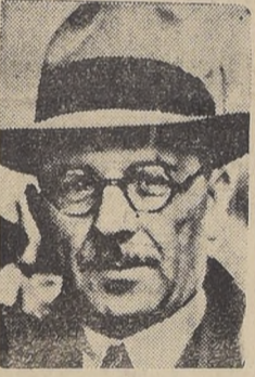
Turquía cree en los principios de San Francisco, en el espíritu del derecho y la justicia... [Caption for the portrait of Sarajoglu.]

LONDRES, 7.-(Agence France Presse).- El sabio irlandés, doctor Armatte declaró hoy día que sobios rusos habrían construido una bomba atómica más poderosa y más manejable que la de los norteamericanos... [The text reports on the alleged creation of a Russian atomic bomb.]