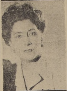
La celebrada actriz Lola Membrives recibirá esta noche en el Municipal el homenaje del público chileno.

Se llevará a efecto esta noche en el escenario del Municipal la anunciada velada en homenaje a la gran actriz argentina Lola Membrives, función que ha logrado despertar en nuestro público un ambiente de inusitada intensidad.