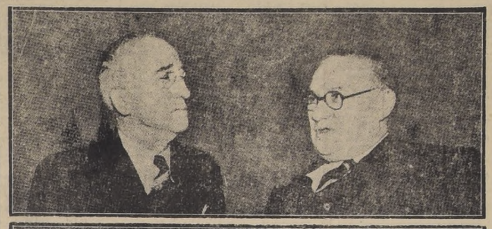
Arriba: Byrnes y Bevin, conferencian en una de las últimas sesiones de la O. N. U. Abajo: la señora Roosevelt en compañía de Sol Bloom y de John Foster Dulles.

"Gran matanza habría habido en Atenas si no es por los ingleses", dijo Bevin