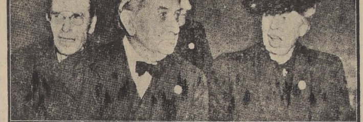
Arriba: Byrnes y Bevin, conferencian en una de las últimas sesiones de la O. N. U. Abajo: la señora Roosevelt en compañía de Sol Bloom y de John Foster Dulles.