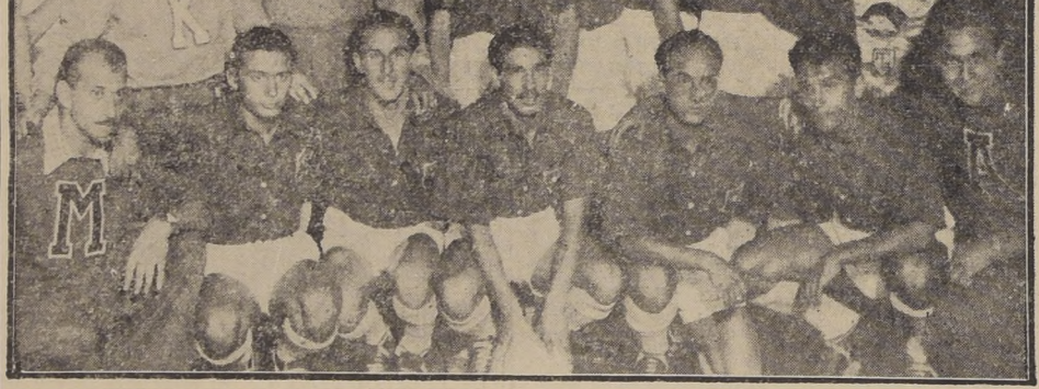
MAÑANA CON BRASIL. — Titulares y suplentes del equipo campeón Sudamericano Extraordinario de Fútbol. — El empate de éste ante Paraguay, la chance de Chile que está en Buenos Aires disputando en el Campeonato enfrenta mañana en la tarde a Brasil.—Después del de nuestra representación, es evidente

En esta ocasión con cuadros que han sido considerados flojos, y han enfrentado a los argentinos siempre con guapeza y optimismo, que siempre hacen peligrar la anticuada victoria.