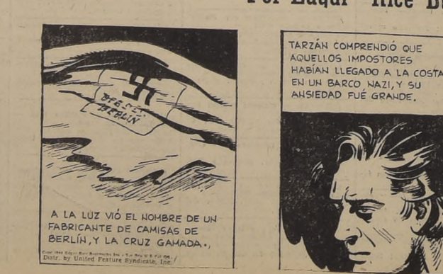
A LA LUZ VIÓ EL NOMBRE DE UN FABRICANTE DE CAMISAS DE BERLIN, Y LA CRUZ GAMADA.