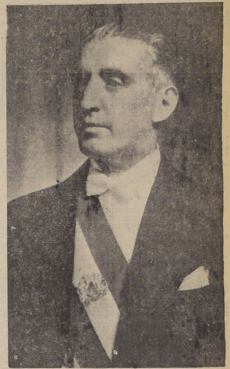
Excmo. señor Juan Antonio Ríos

"TOMEN UD. Y LOS HOMBRES QUE LE ACOMPAÑAN EN SU GOBIERNO LAS DETERMINACIONES QUE CREAN QUE MEJOR ENCUADRAN CON LA TRANQUILIDAD NACIONAL Y EL PROGRESO DEL PAIS". — TEXTO DE LA COMUNICACION DE S. E.