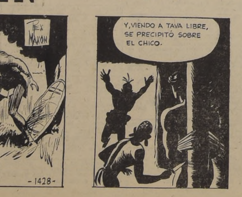
UN GUARDIA ENCARGADO DE LA CUSTODIA DE TARZAN, OYÓ RUIDO EN LA CHOZA.