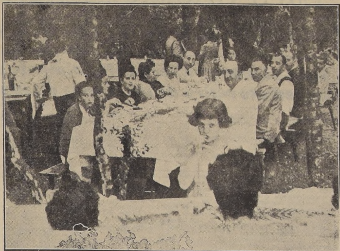
Veraneantes sirviéndose un almuerzo campestre en los bosques que circundan el Lago Puyehue