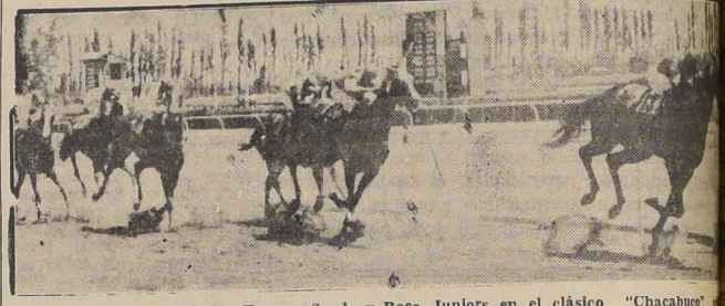
Rechupete derrota a Princep Konyoye, Spada y Boca Juniors en el clásico "Chacabuco" ayer en La Palma.