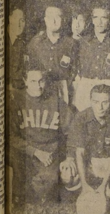
COMPARARON CON SU COMETIDO. — Futbolistas chilenos que efectuaron una labor de acuerdo con lo que se esperaba. El cuadro se clasificó cuarto, junto con Uruguay.

COMPARATIVAMENTE, LA ACTUALIDAD DEL MISMO FUTBOL