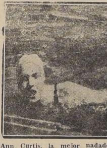
Ann Curtis, la mejor nadadora de Estados Unidos.

Mis Ann Curtis, de 19 años de edad, es la nadadora que tiene en su poder la mejor cantidad de títulos nacionales y mundiales que haya acumulado una mujer en los Estados Unidos. A mediados del mes se disputaron en Chicago los campeonatos femeninos nacionales, en los que defendió con éxito los títulos en los 200 y 400 yardas en estilo libre y conquistó además el de las 100 yardas. Integró también el team de San Francisco, en la prueba de 400 yardas que resultó ganadora.