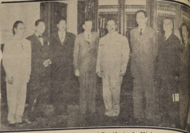
En la presente fotografía aparecen el Presidente de México, señor Avila Camacho, con los miembros del Comité organizador del Quinto Congreso Americano de Maestros...