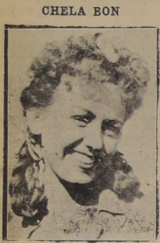
La celebrada actriz nacional, que desempeña el rol juvenil en la película de Chile Films "El Padre Pitillo", que se estrenará hoy en las funciones de los Teatros Santa Lucía y Continental.