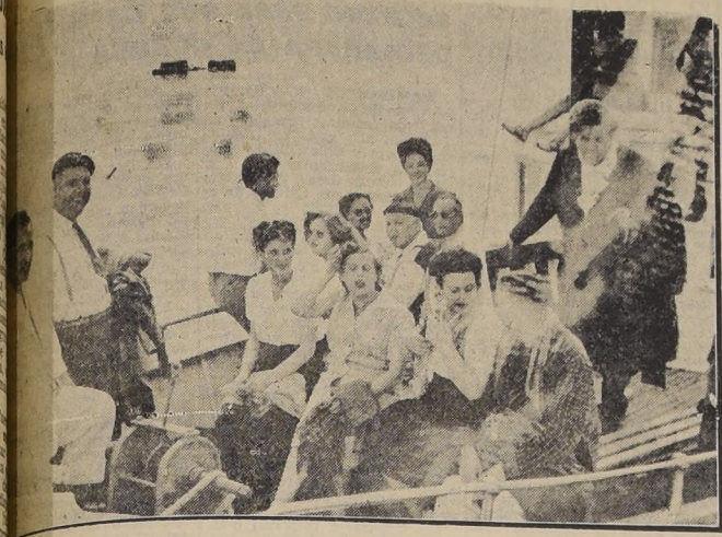
...antes a bordo del Vapor Carrera, durante una excursión por el Lago Puyehue.