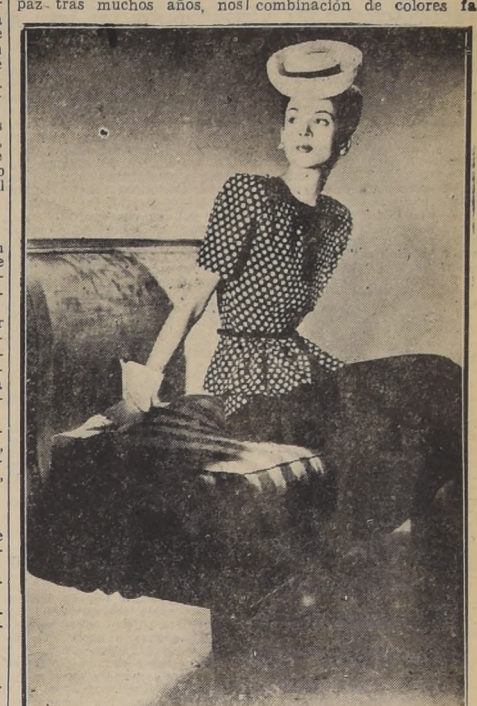
Modelo azul marino negro salpicado de blanco, creado para días cálidos, adecuado para la ciudad y el campo. Original de Henri Bendel, Nueva York.

Nueva York, febrero de 1946.—(Por Correo Aéreo). A medida que anticipamos la primera primavera neoyorquina de un mundo en paz tras muchos años, nos