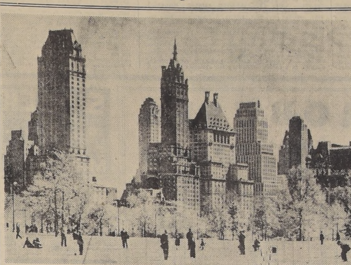
Rascacielos en el Parque Central de Nueva York.