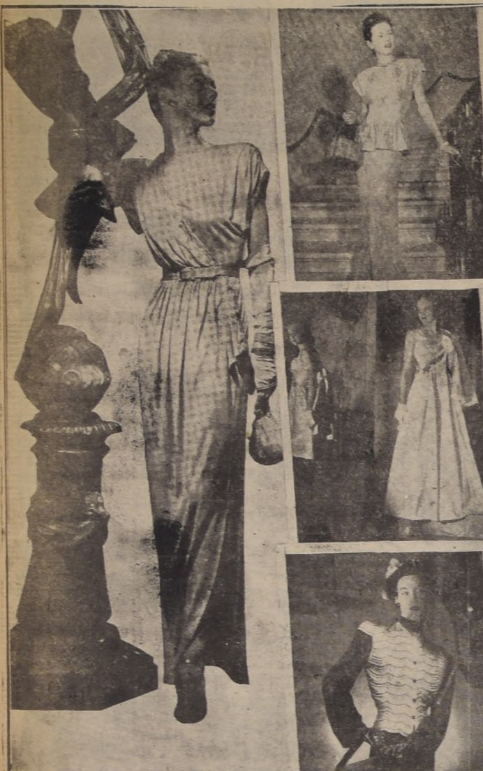
Los rasgos distintivos de este vestido de noche son de crepón jersey de rayón.— Este primer vestido de artista nocturno, es de crepón áspero de hilaza de rayón.— Con este encantador vestido de gran blanco de rayón y algodón, qué jovenita no luce? El raso dorado acolchado y con adornos de azabache le da a esta linda chaqueta, en la parte delantera, el aspecto de una coraza de ambiente medieval.

Al salir de las creadoras mano de los principales adelantos tecnológicos del mundo de las modas, las lujosas telas de rayón están proporcionando a las mujeres estadounidenses prendas de vestir que dan la nota de elegancia en las más sutiles funciones sociales. Con tal o cual género y tal o cual color como bases de distinción, hábiles modistas han creado para funciones, ora diurnas, ora nocturnas, vestidos que son verdaderos primeros. Fácil es encontrar vestidos de modas, con telas que se prestan lo mismo para el día que para ajustarse a los lindos contornos y curvas del cuerpo femenino.