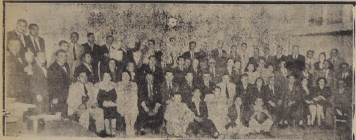
Aspecto de los asistentes al acto conmemorativo del 10.º aniversario de la Federación Provincial Mutualista.