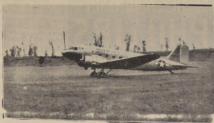
Un Douglas de la Misión Militar de los Estados Unidos, en el Aeropuerto de Puyehue