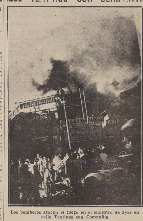
Los bomberos atacan el fuego en el siniestro de ayer en calle Teatinos con Compañía