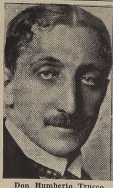
Don Humberto Trucco

El día de ayer se inauguró el nuevo año judicial, con asistencia de los señores jueces de la Corte Suprema, jueces de las Cortes de Apelaciones, jueces del Colegio de Abogados, el señor Fiscal General y distinguidas personalidades.