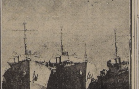
Fotografías de las corbetas de construcción canadiense compradas últimamente por el Gobierno.