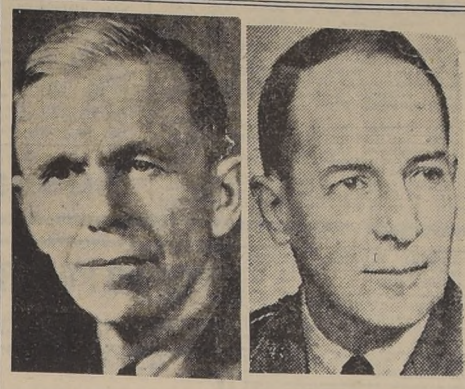
El general Marshall

El general Marshall partió esta noche para Tokio donde conferenciará con el General Mac Arthur sobre la situación en Manchuria; se espera que ambas partes lleguen a un acuerdo sobre la necesidad de personal para el cumplimiento de los deberes de cesar las hostilidades y la conveniencia de enviar más oficiales y personal a Manchuria.