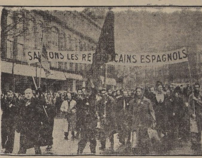
Manifestación contra Franco en París. — El cartel dice: Salve-mos a los republicanos españoles.