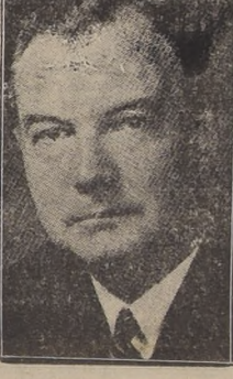
El juez Robert H. Jackson

Hitler y Goering se negaron a creer en la capacidad de producción de EE. UU. y Rusia