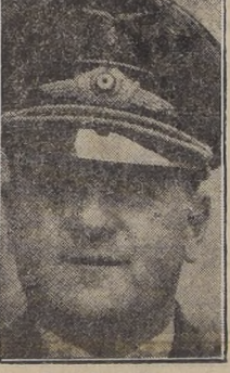
El mariscal Milch