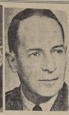
El general Mc Arthur