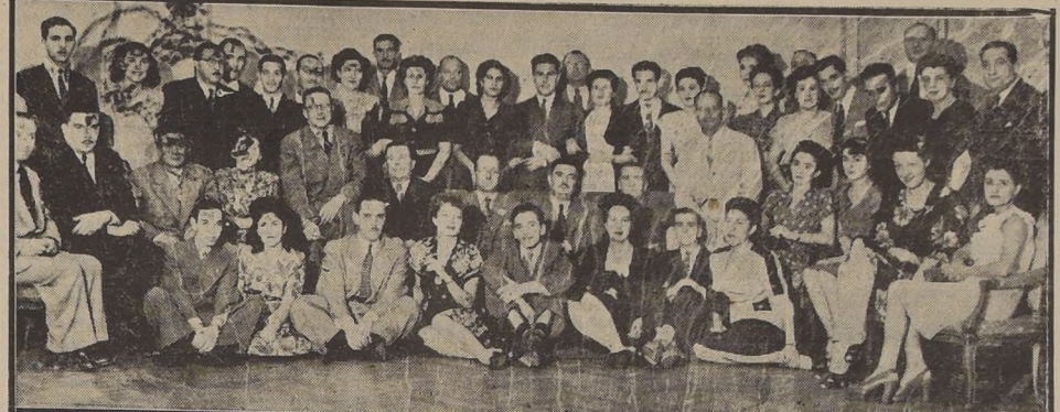
Asistentes al cocktail efectuado en los salones del Hotel Crillon con motivo del aniversario de la Compañía de Seguros La Mercantil.