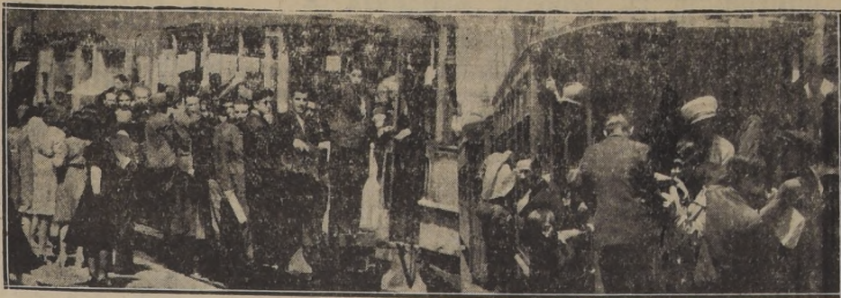
Este es el espectáculo diario en las calles de la capital que LA NACION señala como un verdadero atentado a la población.

3. El primer semestre de fun- cionamiento de estos cursos ten- drá carácter de prueba, y los es- tudiantes deberán demostrar con- diciones compatibles con el ejer- cicio de la Enseñanza Parvularia. 4. Al término satisfactorio del segundo semestre, las alumnas elegirán tema para una Memoria de Prueba, la que presentarán a la Dirección de dicha Escuela Normal, en el transcurso del último semestre, para su cali- ficación. El título de Normalista en Enseñanza Parvularia es in- dispensable para ejercer la docen- cia en los grados parvularios de la Enseñanza Primaria. 5. Los antecedentes se reciben en la Oficina de Partes de la Direc- ción General de Educación Pri- mario, y en la Escuela Normal N.º 2, hasta el sábado 30 del presente mes de marzo.