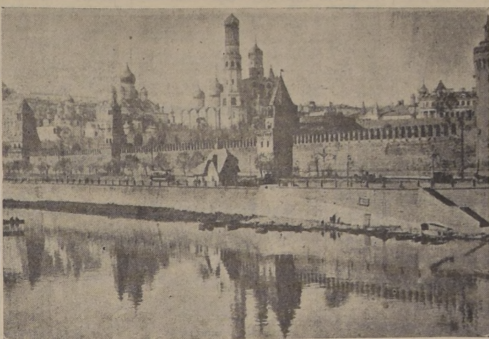
Vista exterior de la ciudad amurallada del Kremlin en Moscú, en uno de cuyos edificios se reunió ayer el Soviet Supremo, en momentos en que se agrava la tensión internacional