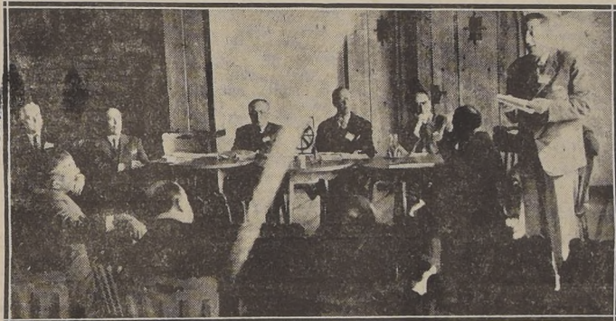
Mesa directiva de la última Convención Rotaria, en su primera sesión de trabajo