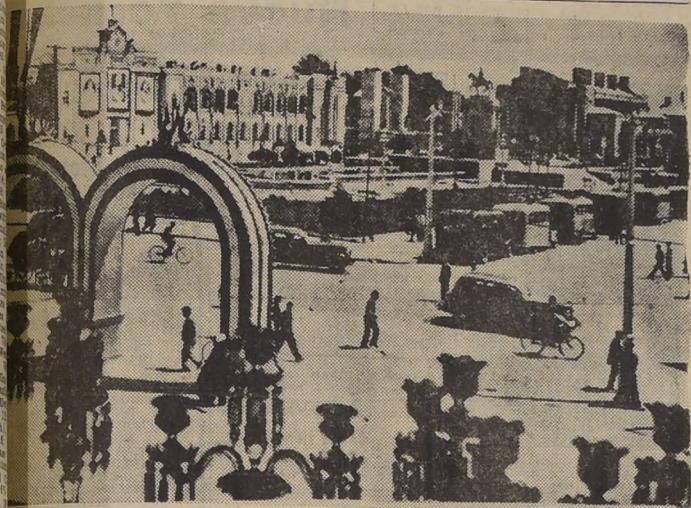
Teherán, capital del Reino del Irán (Persia) hacia donde se aproximan las fuerzas rusas armadas con equipo de guerra.