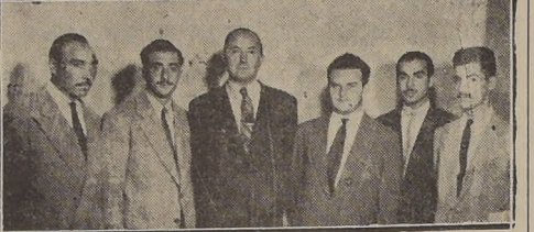
Jóvenes uruguayos que visitaron ayer LA NACION

AYER VISITARON "LA NACION". — PORTADORES DE UNA BANDERA URUGUAYA Y UN RETRATO-AUTOGRAFO DEL PRESIDENTE AMEZAGA