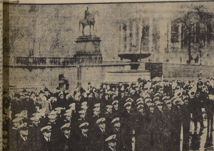
Los marineros chilenos en la capital inglesa.