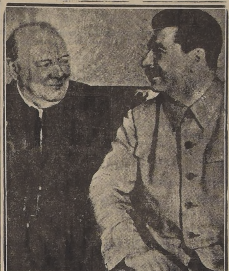
Churchill y Stalin durante una de sus cordiales entrevistas en el Kremlin.

El siguiente es el texto de la declaración de Stalin: "Hace pocos días un corresponsal me preguntó si se reanudarían las negociaciones."