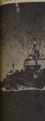
La fragata "Esmeralda", construida en astilleros canadienses.