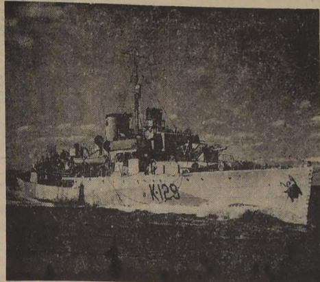
Una de las corbetas adquiridas por el Gobierno de Chile

Las fragatas como unidad de guerra y Real Armada, usada durante los años de la pasada guerra para combatir a los submarinos, ha sido equipada por un barco de mayor radio de acción y mayor poder de ataque.