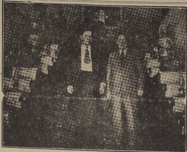
El Primer Ministro iraní, Ahmed Ghavam, acompañado de Wendell Wilkie, durante la visita que este último realizó a Teherán en 1942.