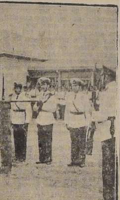
Los universitarios prestan el Juramento a la Bandera